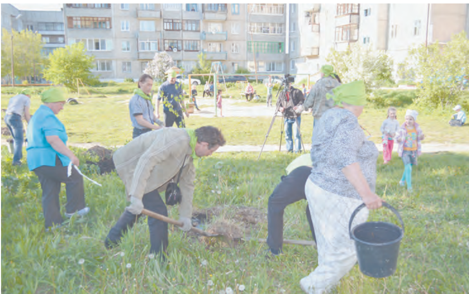
Луначарского, 8: общественники на посадке

Галина Антипина.