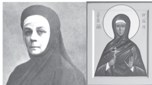
Преподобномученица инокиня Варвара

Елисавета Феодоровна и князь Иоанн упали не на дно шахты, а на выступ, находящийся на глубине 15 метров. Сильно израненная, она оторвала от своего апостольника часть ткани и