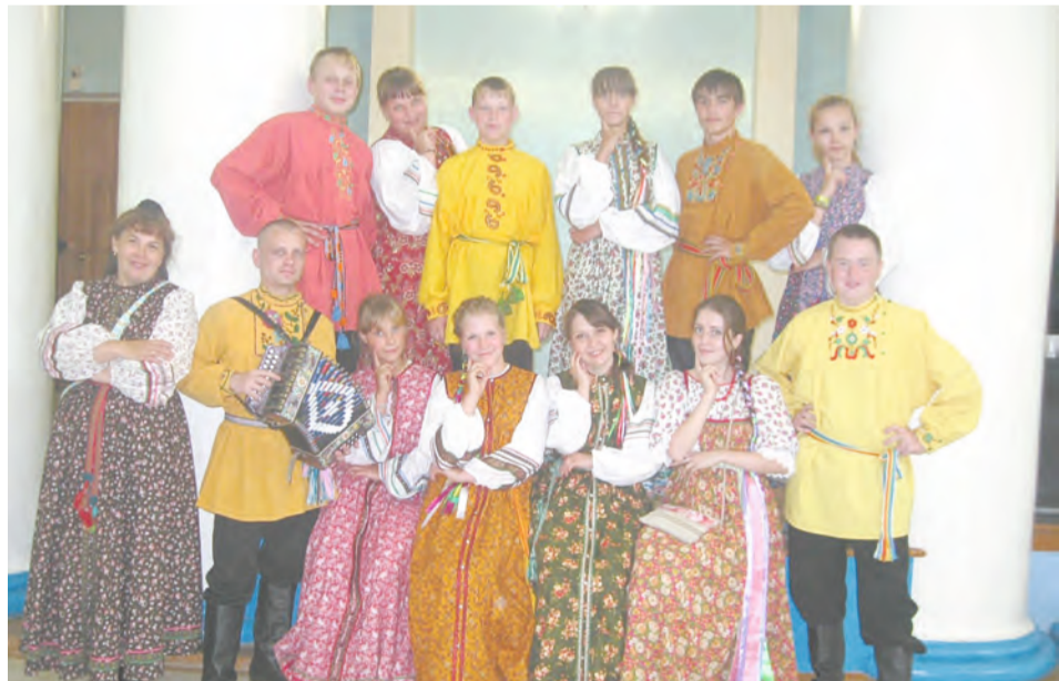
г. Богданович, лауреаты областного конкурса «Гуляние на Кашинском городище»

В этом году молодежный ансамбль «Спутник» отмечает свое десятилетие.