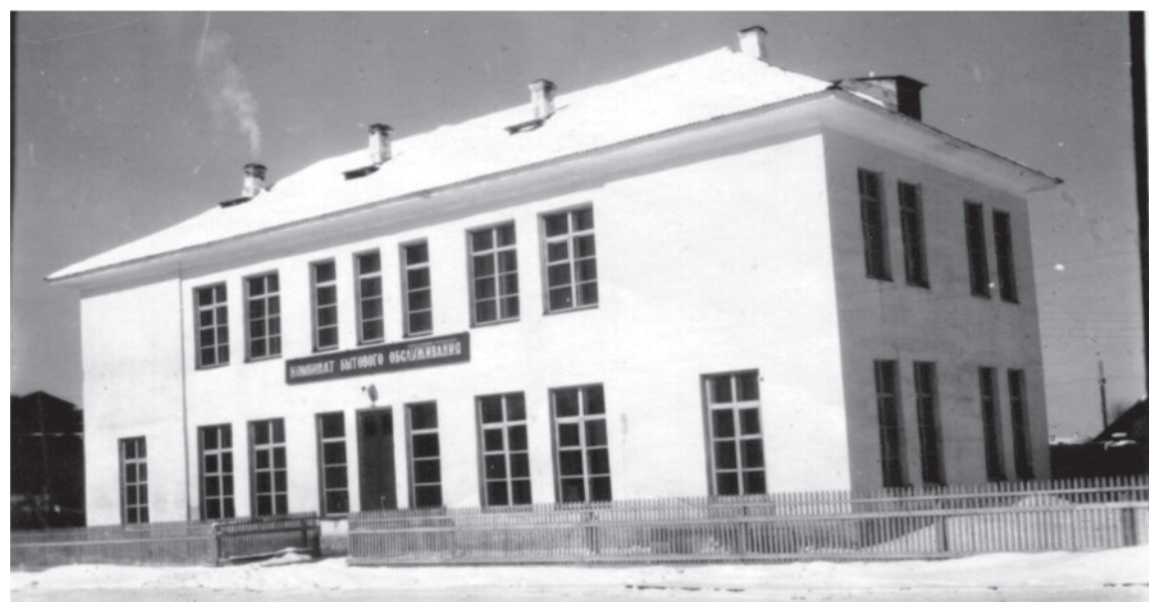
1959 год. Новое здание быткомбината.

тий, старых зданий, природных ландшафтов, а также групповые, одиночные или семейные портреты. Каждая фотография должна сопровождаться информацией о том, когда и где она сделана, что на ней изображено (или кто изображен), от кого получена.