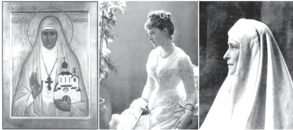
Преподобномученица великая княгиня Елисавета

В ее письмах того времени есть следующие слова: "Я испытывала такую глубокую жалость к России и ее детям, которые в настоящее время не знают, что творят. Разве это не больной ребенок, которого мы любим во сто раз больше во время его болезни, чем когда он весел и здоров? Хотелось бы понести его страдания, помочь ему. Святая Россия не