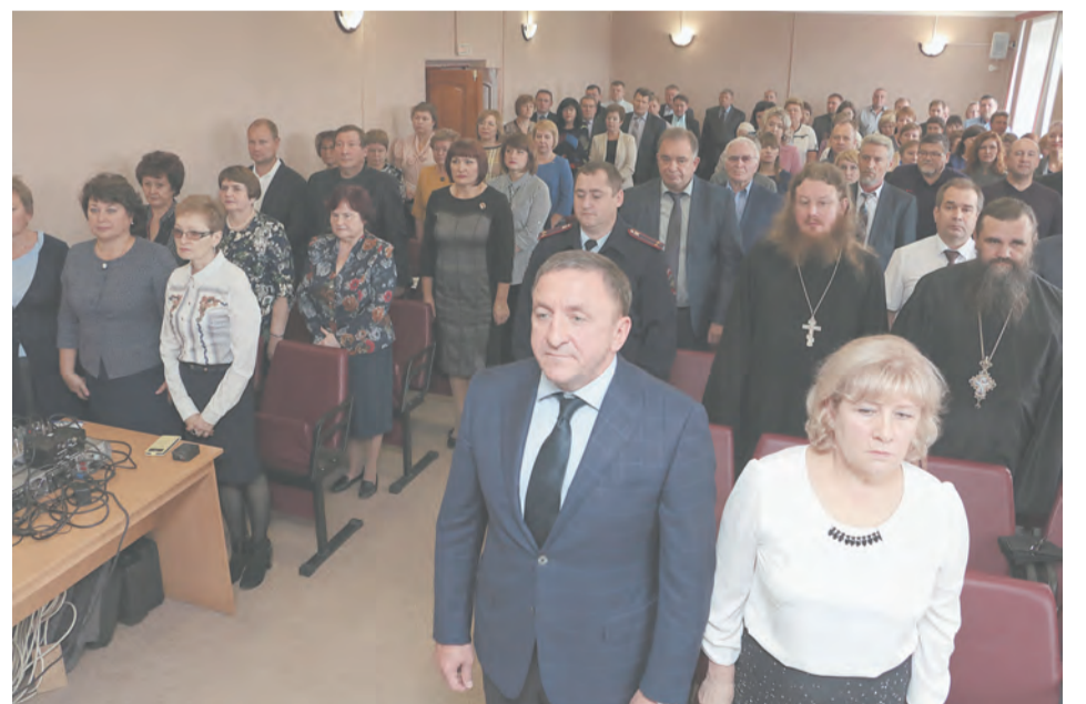
Это и для нас слова гимна РФ: «Славься, Отечество наше свободное...»

разу не разочаровался в его деловых и руководящих качествах.