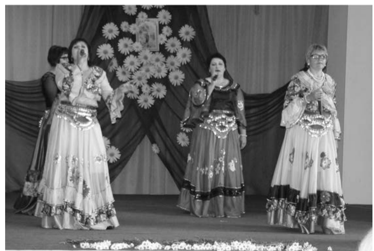
Четыре сестры Пановы из В-Юрмыта

Для принятия участия в конкурсе необходимо обратиться в отдел мониторинга экономического развития и потребительского рынка администрации Талицкого городского округа по адресу: г. Талица, ул. Луначарского, 59 (каб. №16) или по телефону 2-13-62 в срок до 22.07.2014