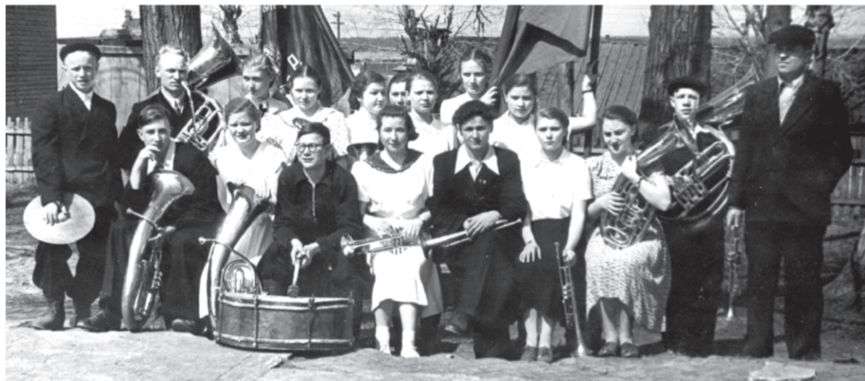
Духовой оркестр. 1956 год

... Очень быстро идет время, но и сейчас, когда играет в Талице духовой оркестр, я подхожу поближе, чтобы еще раз услышать и вспомнить мелодии нашей юности.