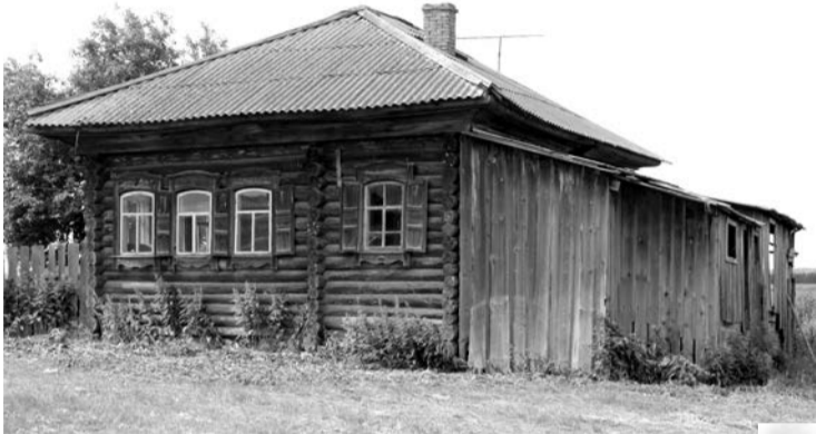
Полуразваленный дом некогда был домашним очагом для какой-то семьи

Молодых семей в этой деревеньке можно по пальцам пересчитать