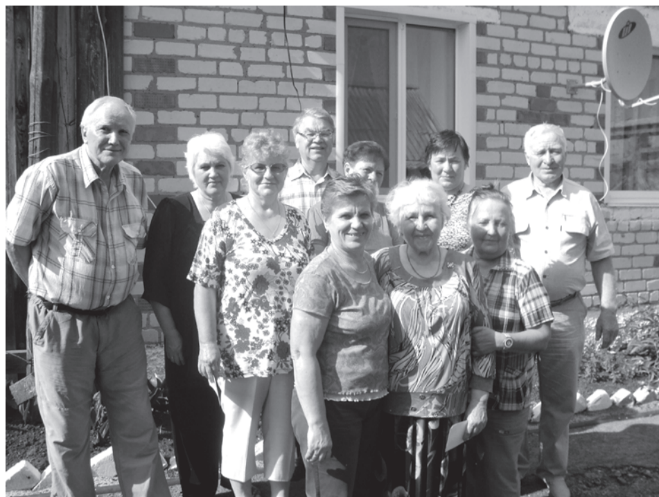
Такие встречи всем нам доставляют радость