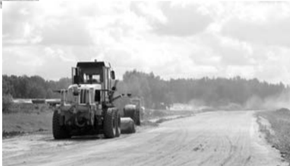
На эту дорогу у жителей большие надежды

Как я уже упоминала, трудоустроиться в деревушке негде. Мужчины, в основном, работают на буткинских пилорамах. За счет личных подсобных хозяйств живут еще несколько семей. Содержится большое количество свиней, овец, кур. В общем, кто не ленится, тот обеспечивает свой достаток собственными руками. Как это делали их предки в период основания деревни. А вот коров в Непеиной всего три. А раньше