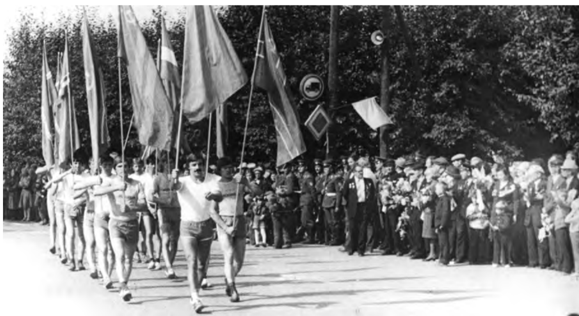
22 августа 1982 г. Талице - 250 лет.