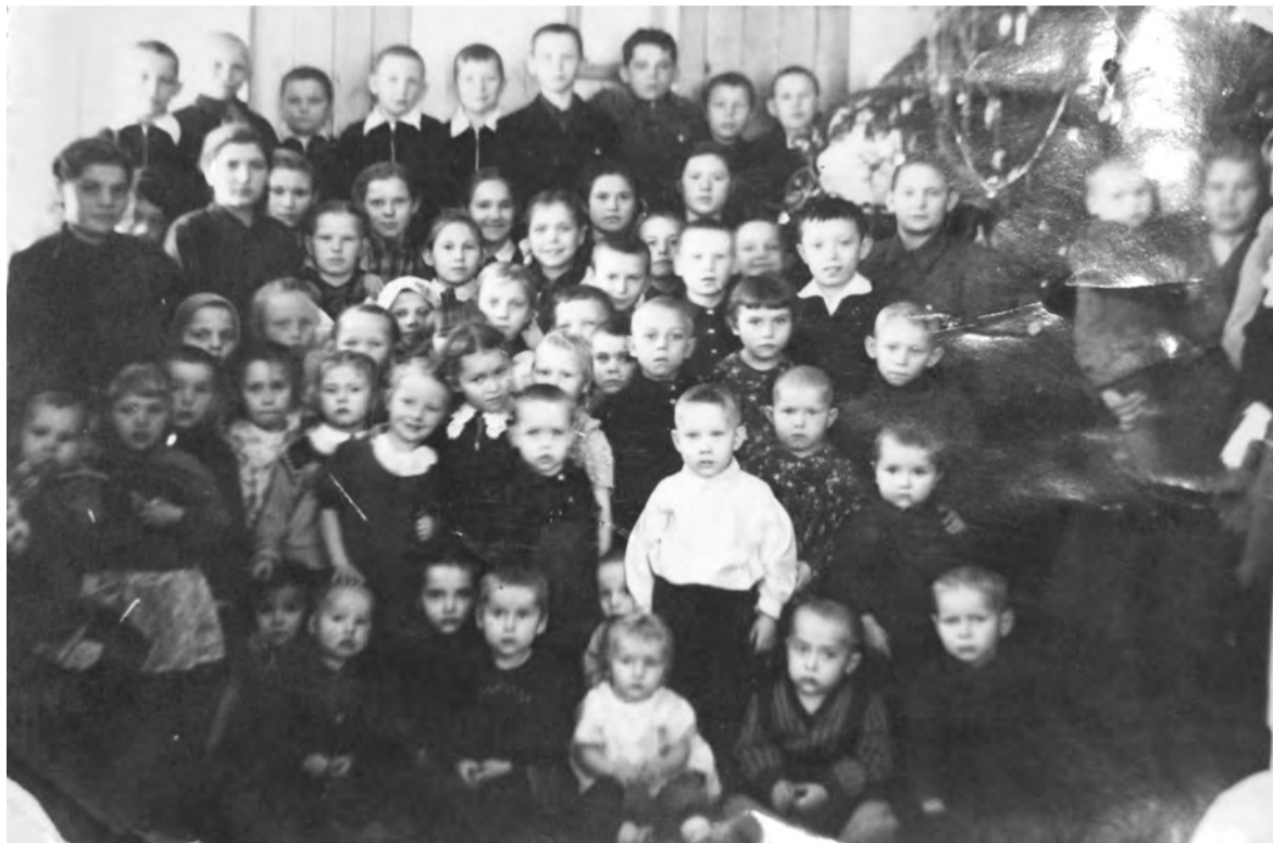
Новогодняя елка для детей в заготконторе. 1 января 1954 года.

тий, старых зданий, природных ландшафтов, а также групповые, одиночные или семейные портреты. Каждая фотография должна сопровождаться информацией о том, когда и где она сделана, что на ней изображено (или кто изображен), от кого получена.