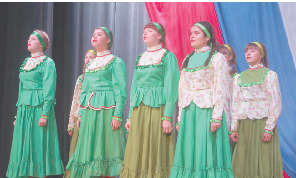
Детская обрядовая группа «Скоморошенки»

ности украинского национального костюма.