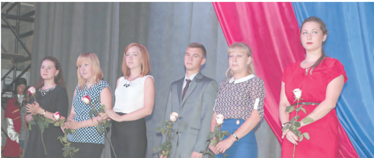
Молодые педагоги Талицкого ГО

Сегодня для более 8 тысяч учеников распахнут свои двери 26 образовательных учреждений Талицкого городского округа