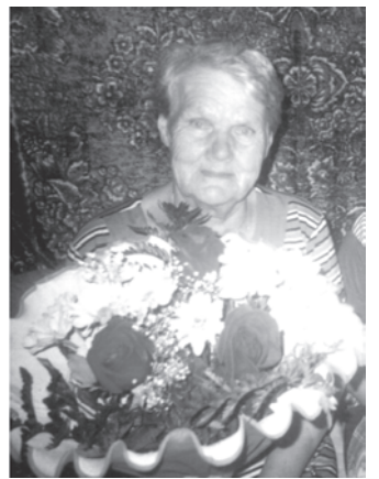
СПК «Труд» и Совет ветеранов. с. Горбуновское

И солнце улыбнется пусть с утра, И пожелает ласково лучами На годы долгие добра. Желаем счастья и здоровья. Желаем бодрости и сил, Чтоб каждый день обычной жизни Одну лишь радость приносил!