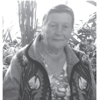
СПК «Труд» и Совет ветеранов

70- долгий путь, нелегкий, Время внуков, правнуков, детей. В этом мире вы не одиноки, Улыбнитесь в этот юбилей. Пусть здоровье ваше будет крепким, Пусть ласкает солнышко теплом, Пусть родные, близкие и дети Наполняют радостью ваш дом!