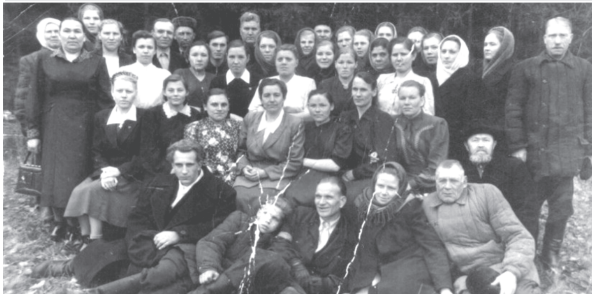
Талицкая кооперативно-промышленная артель «Всходы» в парке Талицкого лесотехнического техникума. 1956 год.

Каждая фотография должна сопровождаться информацией о том, когда и где она сделана, что на ней изображено (или кто изображен), от кого получена.