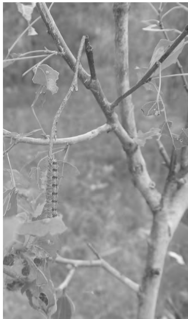
Гусеница шелкопряда обгладывает листву

Первыми тревогу забили жители смолинской и катарачской территорий. Они сообщили, что деревья в лесном массиве возле дорог стоят голые и это в период озеленения. Комиссия Талицкого лесничества выехала на обследование леса. Вердикт неутешительный – свирепствует непарный шелкопряд. Его гусеницы повреждают более 300 видов растений – почти все лиственные породы и некоторые хвойные (лиственница, сосна, пихта), плодовые деревья и кустарники, культур-