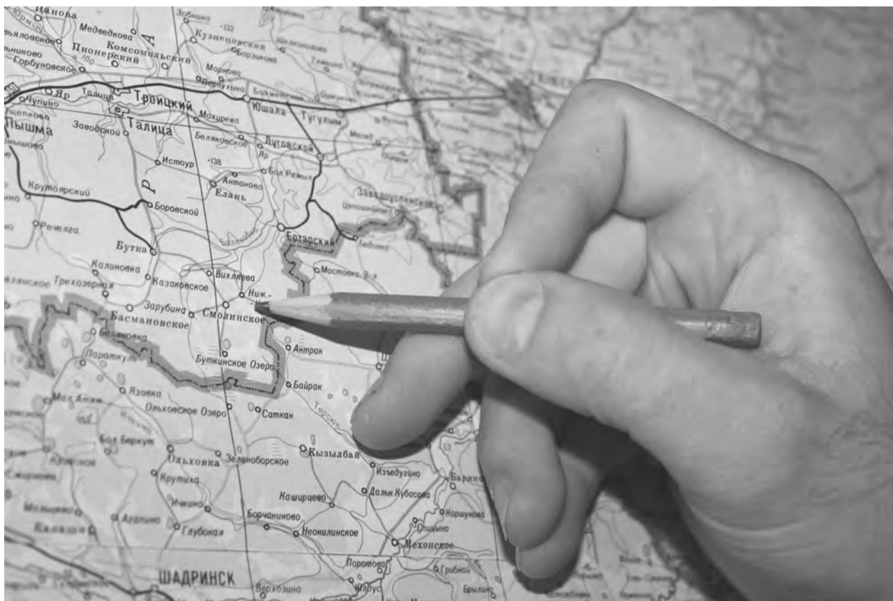
Зона повреждения леса

427 га леса Талицкого района повреждены вредителем. Странная картина: леса юго-восточной части района летом стоят «голые» - непарный шелкопряд полностью съел листву.