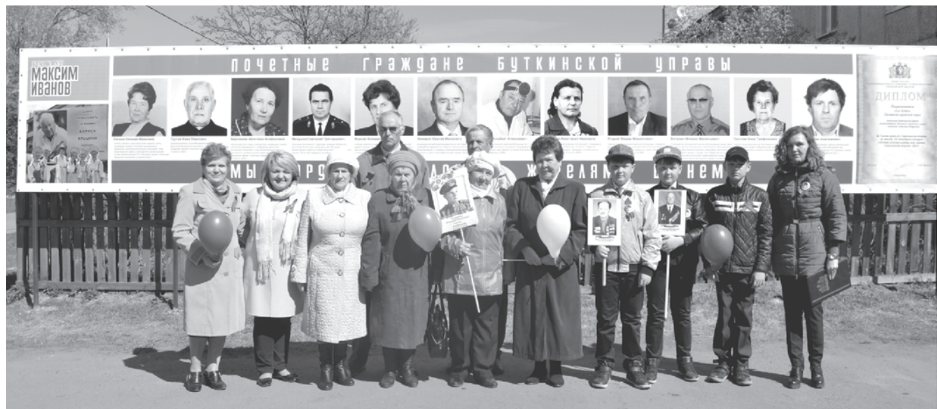
У мемориала почетным жителям

Выборы скоро. Кто-то агитки клеит, а кто-то серьезно работает.