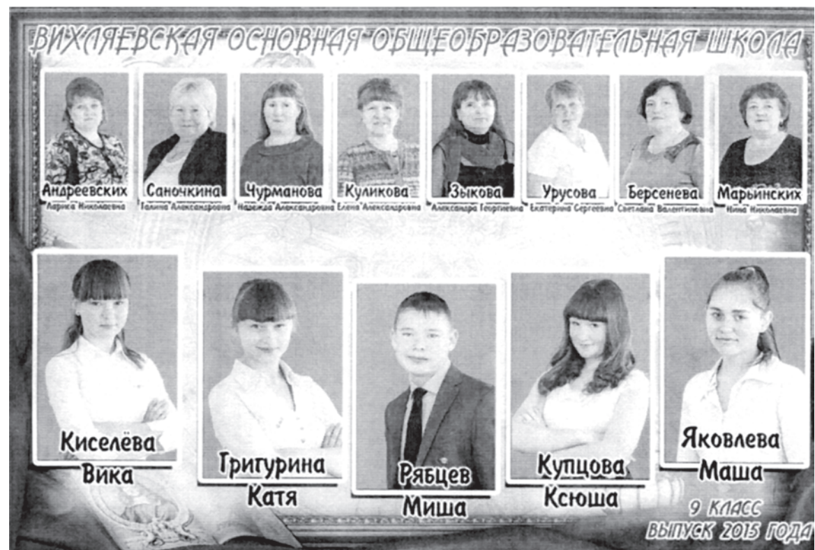
Вихляевская общеобразовательная школа. 9 класс, 2015 год.