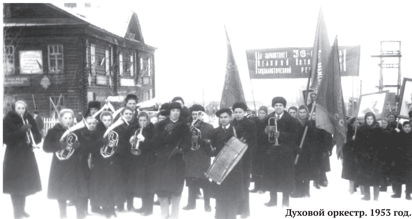
Духовой оркестр. 1953 год.