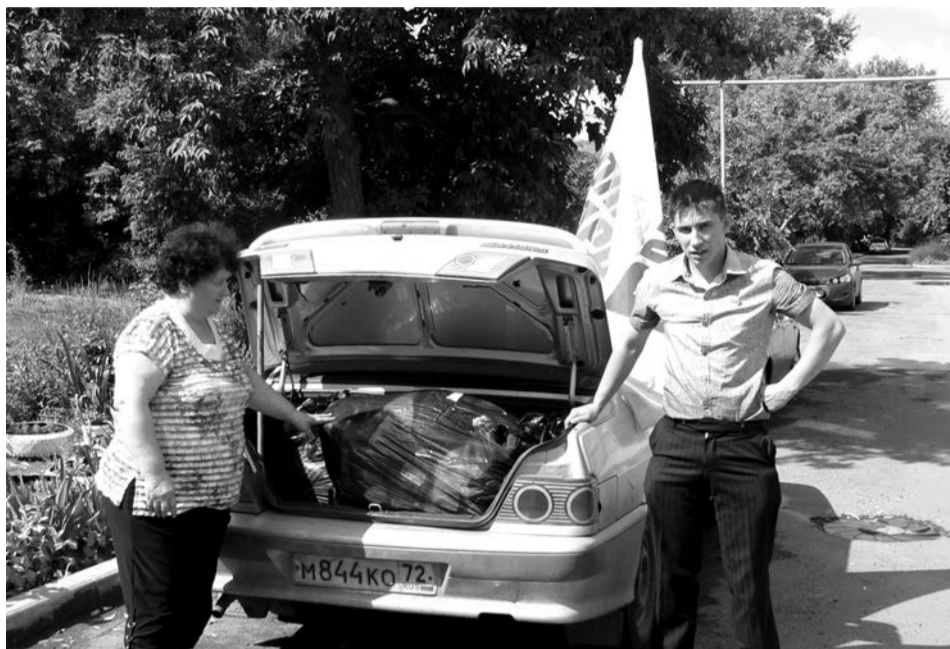
Гуманитарная помощь от таличан уже в пути на Украину

Большинство наших граждан, далеких от политических интриг, до сих пор в недоумении, как может руководство страны допустить уничтожение собственного народа, как можно отдавать приказы бомбить мирное население? Все мы видим по телеэфирам, как люди бегут через границу чуть ли не в пижамах, как умирают прямо на улицах... Гуманитарный коридор для эвакуации мирного населения из зоны боевых действий - это, пожалуй, еди-