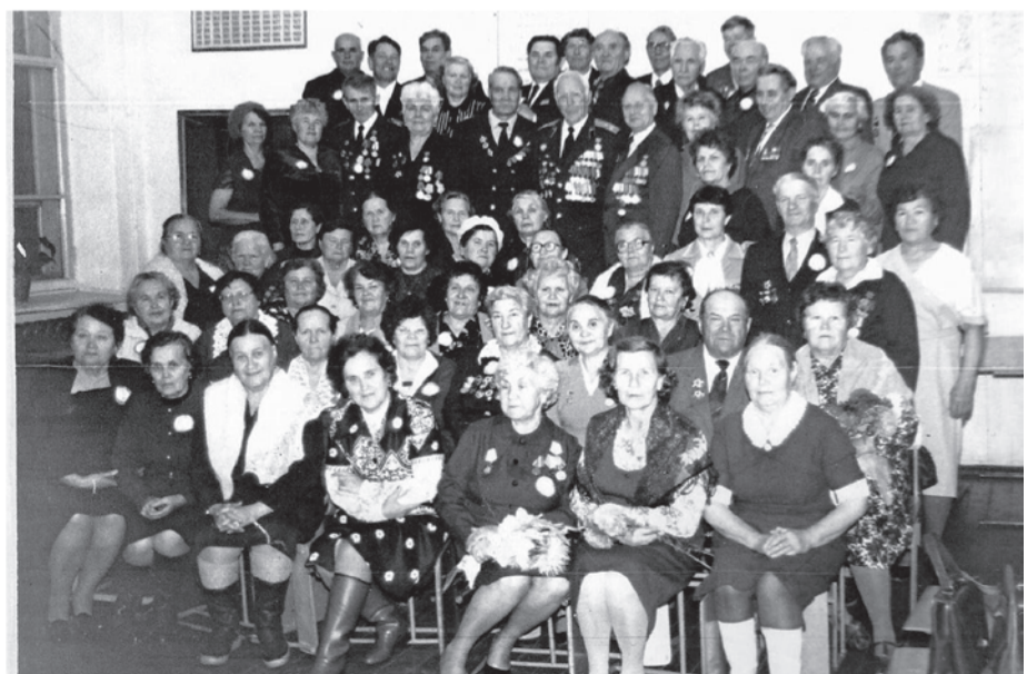
Встреча выпускников предвоенных лет