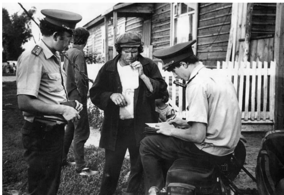
... вот алкотестер и покажет ваше промилле

Слово «попадетсЯ» употреблено не случайно. Вы посмотрите, сколько людей переходят, перебегают дорогу в неположенном месте. Берут за руку детей, показывая, что ЭТО можно, если осторожно. Но статистика из года в год устрашающая – дороги становятся кладбищем машин, людей, местом страшных трагедий. В течение всего года отдел ГИБДД оперативно предоставляет материалы о ДТП в местные СМИ, надеясь, что хоть для кого-то роковые случаи послужат уроком.