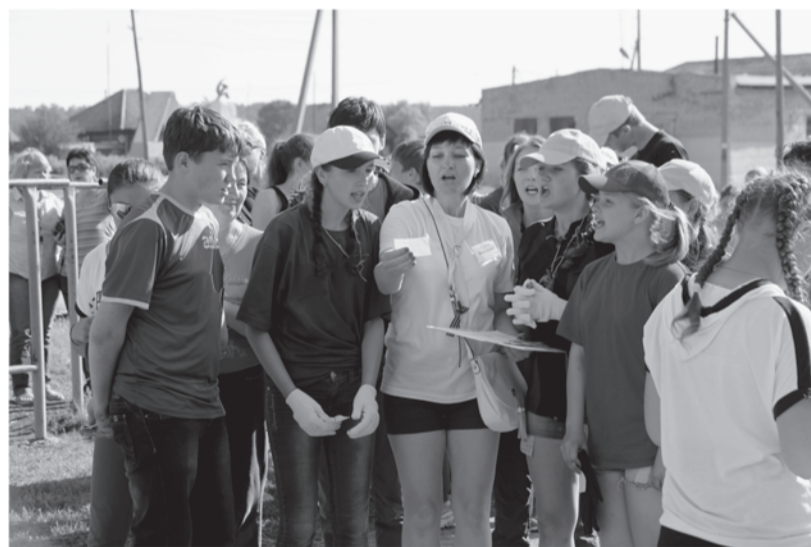
Командная работа по проектам

После торжественного открытия фестиваля на кокуйской