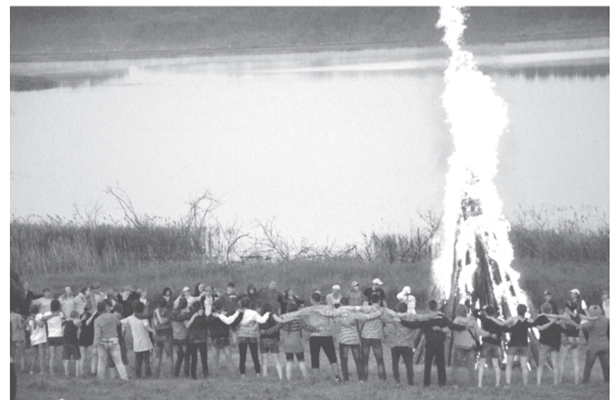
Большой «пионерский костер»

на которой будет проходить районный фестиваль в 2015 году! Флаг передали представителям Яровской управы.