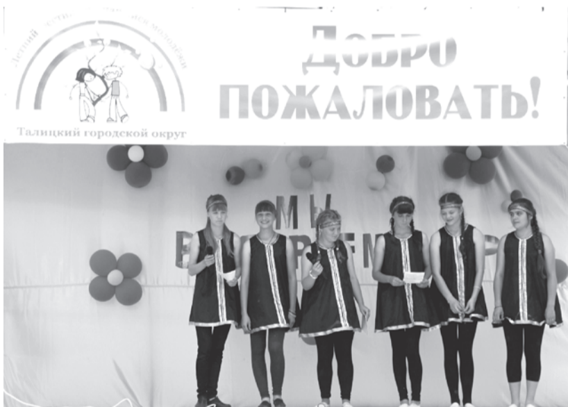
Презентация одной из команд фестиваля

И, конечно, прошла передача флага фестиваля той территории,