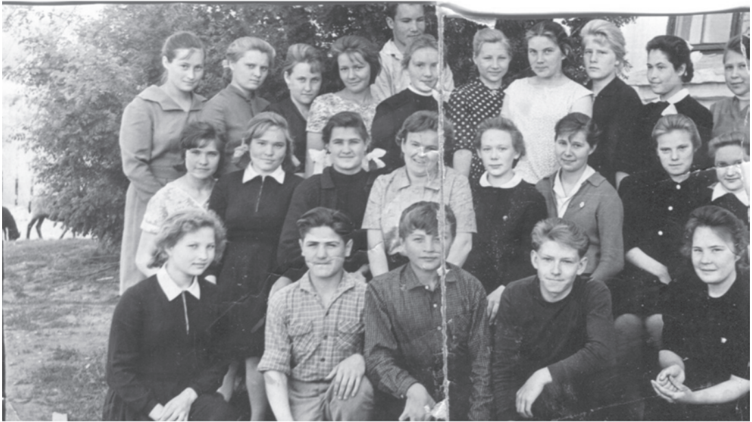
Буткинская средняя школа. 1963-1964 год.