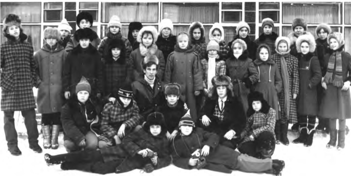
Ученики школы № 8 на экскурсии в г. Перми. 1989 год.