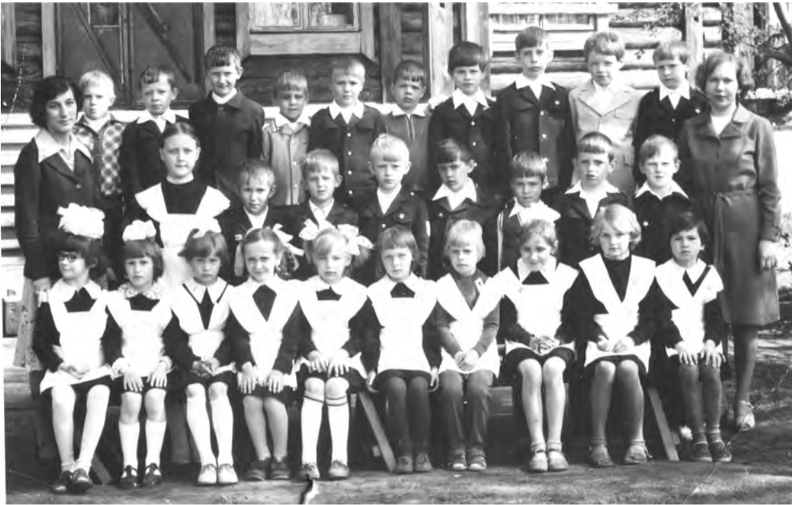
Начальная школа № 8 (Маян), 1979-80 годы.