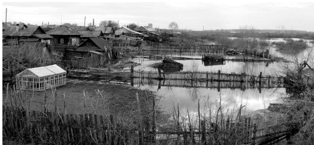
Разлив р. Пышмы