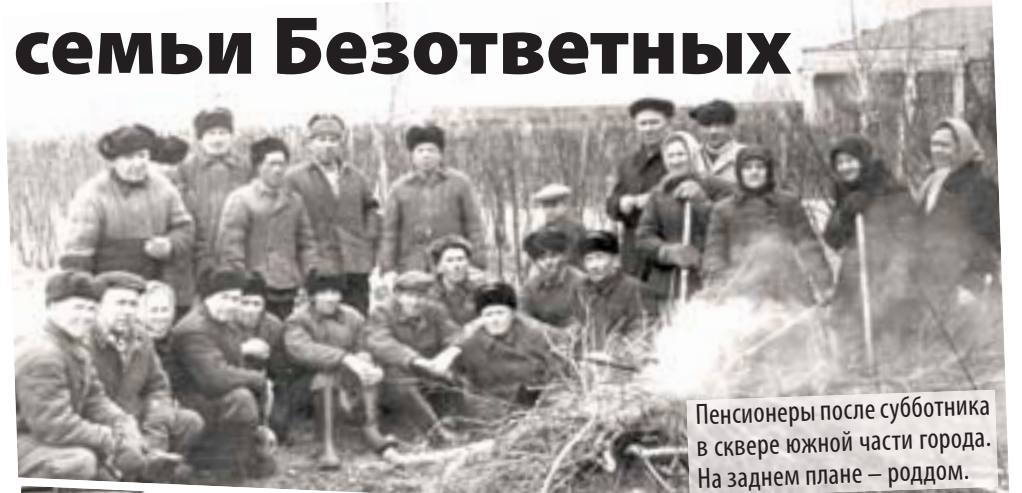
Пенсионеры после субботника в сквере южной части города. На заднем плане – роддом.