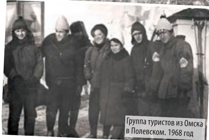
Группа туристов из Омска в Полевском. 1968 год

Если у вас есть раритетные фото, связанные с жизнью Полевского, приносите их в редакцию. Газета «Диалог» предлагает своим читателям ещё раз объединить усилия в создании истории родного города. Приносите снимки, рассказывайте о запечатлённых событиях.