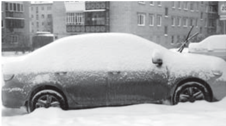
В прошедшие выходные на Урал вновь обрушился сильный снегопад

«Агроцвет» подсыпает дороги противогололёдным материалом под названием «Бионорд». Ольга Викторовна уверила, что на него есть все требуемые сертификаты качества, подтверждённые