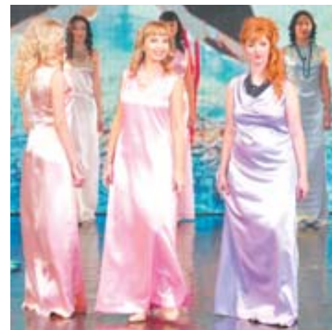
В завершение конкурса «Миссис Евразия – 2016» участницы вышли на сцену в вечерних платьях