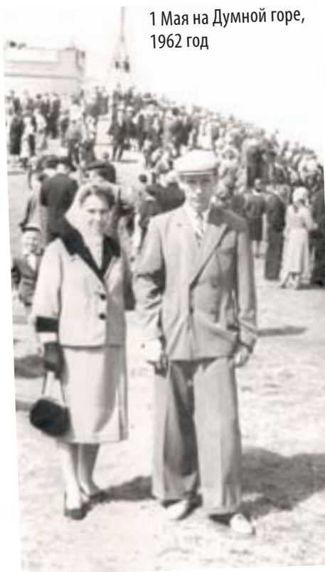
1 Мая на Думной горе, 1962 год