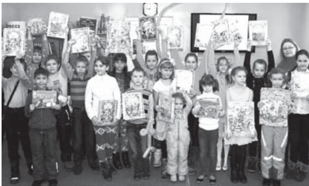
Школьников, прочитавших в течение года по 35 и более книг, отметили в Городской детской библиотеке № 2