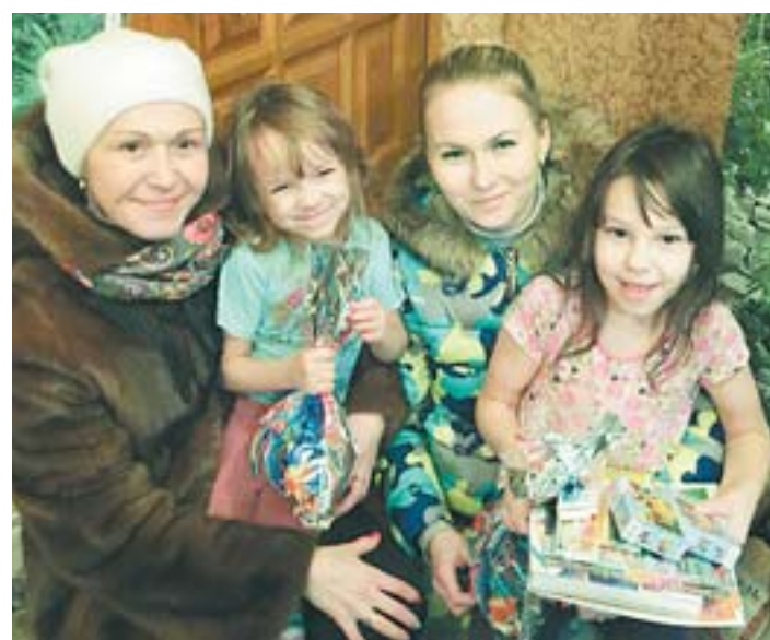
В селе Косой Брод помощницы волонтерской службы «Мамы» поздравили с Новым, 2016 годом детей, оставшихся без попечения родителей

Также есть возможность перечислить денежные средства на карту Сбербанка – 4276816015220468