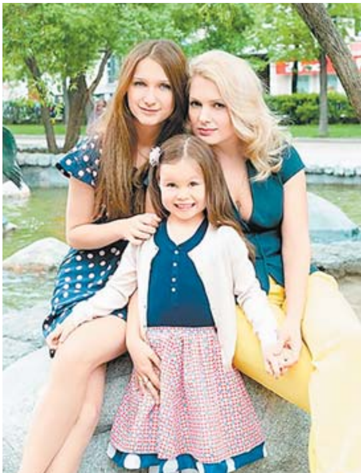
Мария Порошина с дочерьми Полиной и Серафимой

— Всё в нашей жизни настолько сложно. Как правило, такие любовные отношения заканчиваются ничем. То есть так же трогательно, как мы заявили со сцены. А может быть, гораздо сложнее, трагичнее, болезненнее, — говорит Мария Порошина по поводу спектакля. — Тебе кажется, что вот этот мужчина, с которым ты встречаешься раз в год, твоя настоящая