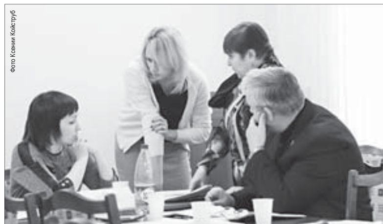
Обсуждение вопросов продолжалось даже во время перерыва

На комитете Думы по соцполитике депутаты обсудили дополнительные меры поддержки нуждающихся в жилье