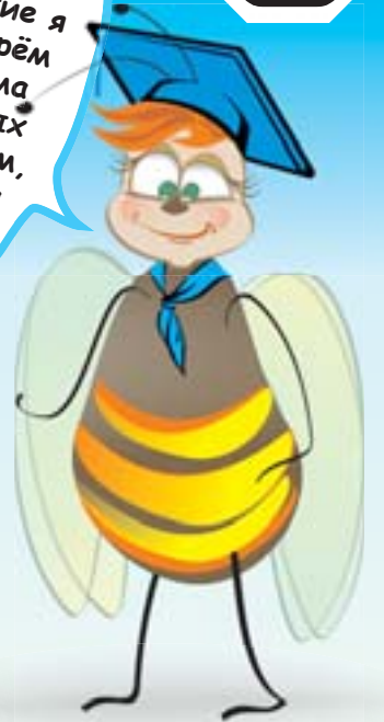
Партнёр рубрики «Детская площадка» ИП Медведев