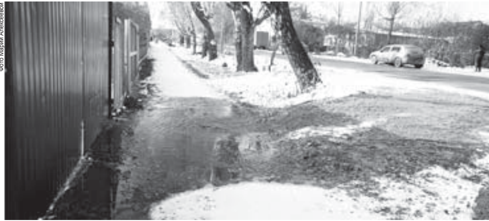
25 октября и 2 ноября на улице Бажова произошёл разлив фекальных стоков: из-за крупного долга МУП «ЖКХ «Полевское» ООО «Чистая вода» поставило на сетях «заглушку»

– «Заглушку» на сетях мы установили, поскольку находимся в безвыходной ситуации – нам нечем платить зарплату людям. В 2015 году действовало трёхстороннее соглашение между ООО «Чистая вода, ОАО «Энергосбыт Плюс» и МУП «ЖКХ «Полевское» о сборе денежных средств, по которому в адрес нашей организации предусмотрен процент расщепления в размере 43,9% от сумм, собранных расчётным центром «Энергосбыт Плюс». С 1 января 2016 года эти