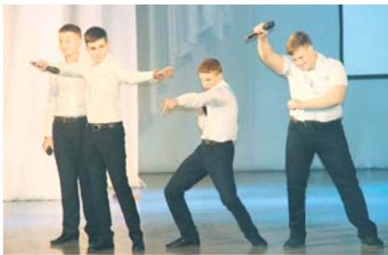
Команда «Пригород» из школы-лица № 4 «Интеллект», как всегда, зажгла

Представители школы № 18 «18 бит» поначалу старались казаться суровыми и опасными, выйдя на сцену с битами и в чёрных банданах, но когда капитан команды под восточную музыку исполнил танец живота, зал ухачатывался. А,