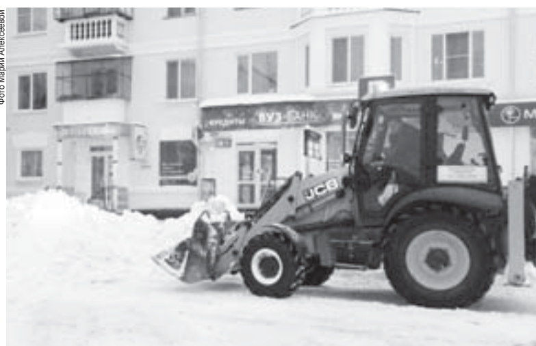
Дорожно-уборочная техника работает на площади Ленина

– Утром 9 ноября на дорогах северной части города остались ещё 8 единиц техники и «Камазы», которые вывозили снег на полиго-