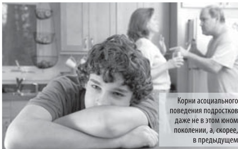
Корни асоциального поведения подростков даже не в этом юном поколении, а, скорее, в предыдущем

– Двое несовершеннолетних из группы уже находились под стражей в колонии на протяжении девяти месяцев, но, к сожалению, так и не сделали долж-