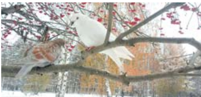
Гроздья рябины под снегом сказочно красивы, а ещё эти ягоды любят зимующие у нас птицы. Екатерина Зубарева сфотографировала двух голубков на рябиновой ветке.