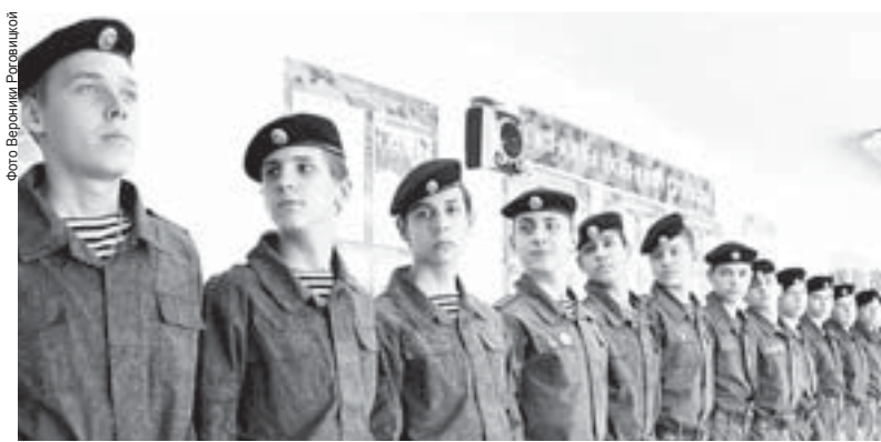
В кадетских классах строевой подготовкой занимаются три часа в неделю

Эту игру ребята очень любят, готовятся к ней основательно, выступают успешно.