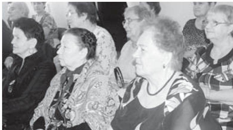
Полевские ветераны представили на суд зрителей фестиваля любительского кино «Рябиновые грозди» 11 видеофильмов

Напомним, что на территории Свердловской области на базе культурно-досуговых учреждений и при учреждениях социального обслуживания населения действуют 738 клубов по интересам для творчески активных людей старшего поколения, в работе которых ежегодно принимают участие более 39 тысяч граждан пожилого возраста и инвалидов.