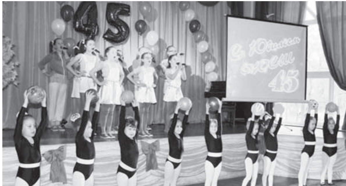
Маленькие спортсменки порадовали зрителей хореографическим номером с гимнастическими элементами