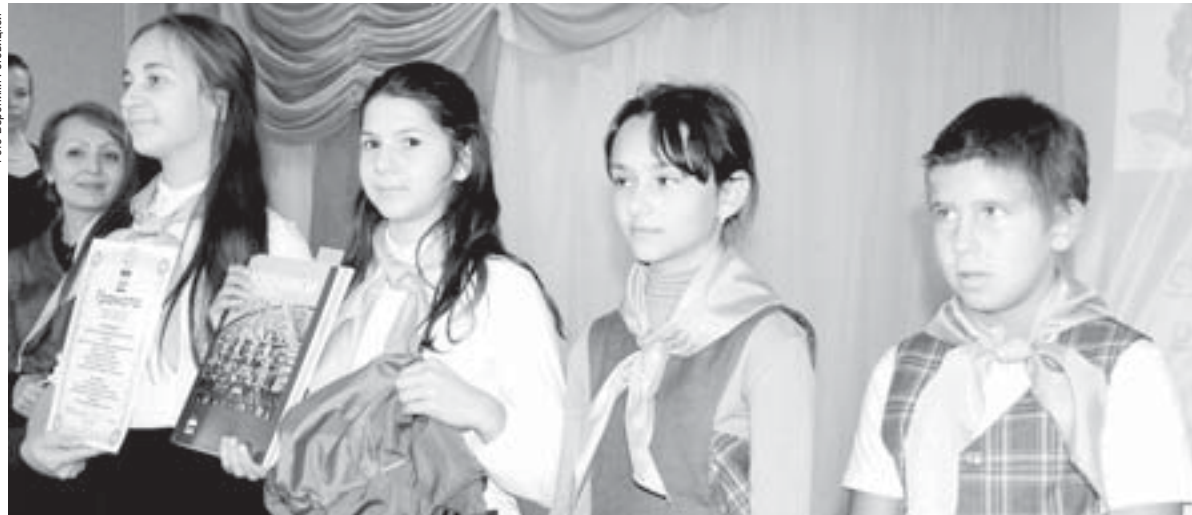
По итогам акции «Живи, родник!» первое место среди сельских отрядов занял отряд школы села Полдневая «Капля»

Напомним, в ежегодной акции «Живи, родник!» в нашем округе принимают участие 17 детских эколого-экспедиционных отрядов – 228 детей, школьники и дошкольники. Все вместе они образуют сводный экологический отряд «Рыцари чистой воды». Дети привлекают внимание окружающих к проблеме состояния местных водоёмов, принимают участие в бла-