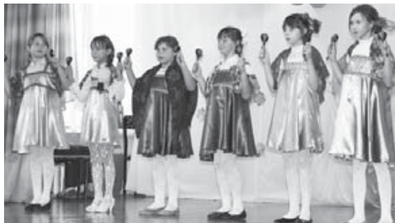
Ученицы школы № 1 посёлка Белооярский исполнили танец «Бабушки»

21 октября в актовом зале школы № 17 состоялся фестиваль для детей с ограниченными возможностями здоровья «Осенняя акварель». Показать свои таланты собрались юные полевчане, обучающиеся по коррекционно-развивающим программам, с родителями и педагогами, а также дети из Екатеринбурга, Новоуральска и