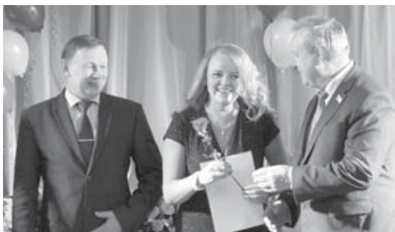
Ни один работник спортивной школы не остался без грамоты и внимания