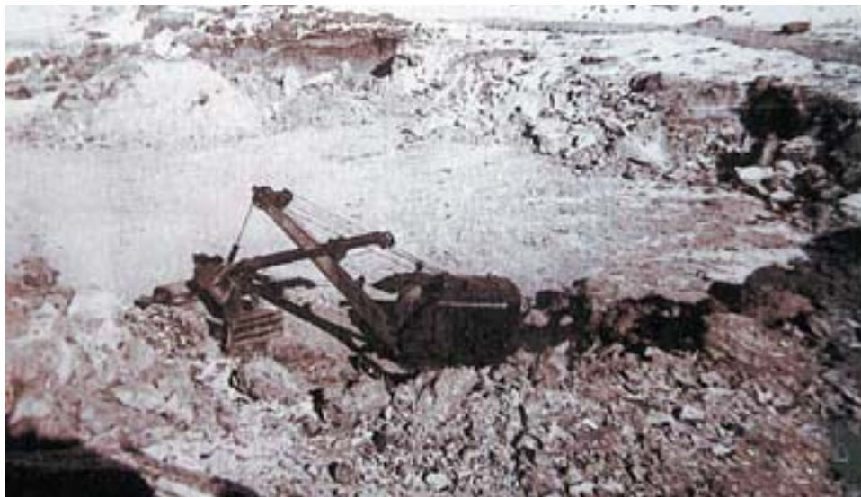
Ивановский рудник. 1950-е годы