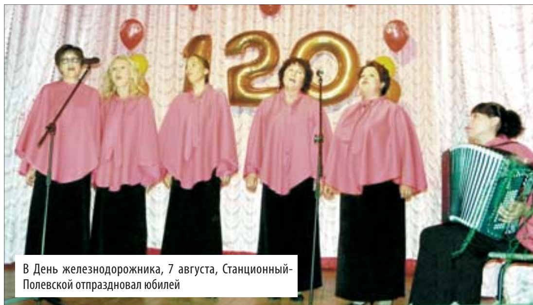
В День железнодорожника, 7 августа, Станционный-Полевской отпраздновал юбилей

В этом году Станционный-Полевской отпраздновал 120-летие