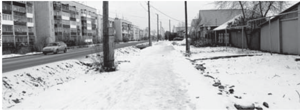
Сейчас заретушированный снегом новый тротуар выглядит вполне симпатично