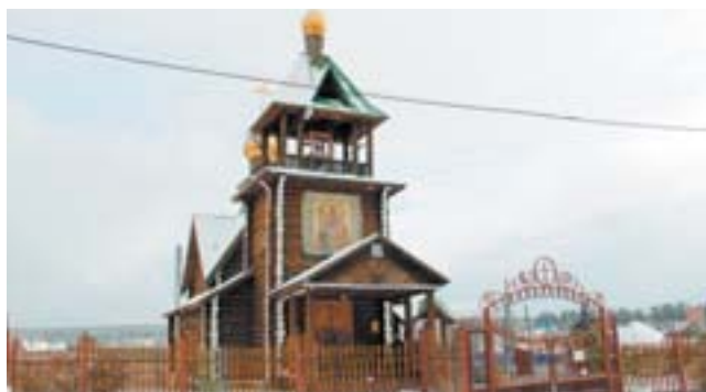
Храм в честь святого равноапостольного князя Владимира. Каждый год 28 июля в Станционном-Полевском проводят массовое крещение в реке Чусовой

– В то время факультет давал образование не меньше чем по 400 специальностям – от технички до министра путей сообщения.