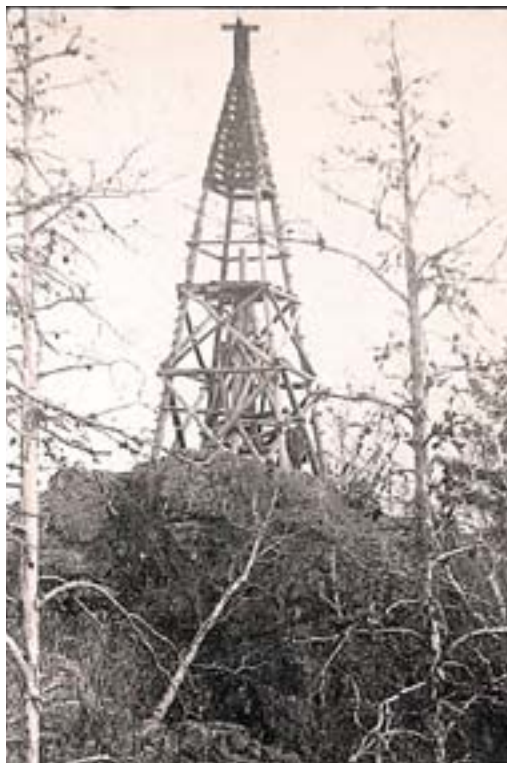
Триангуляционная вышка на Азов-горе