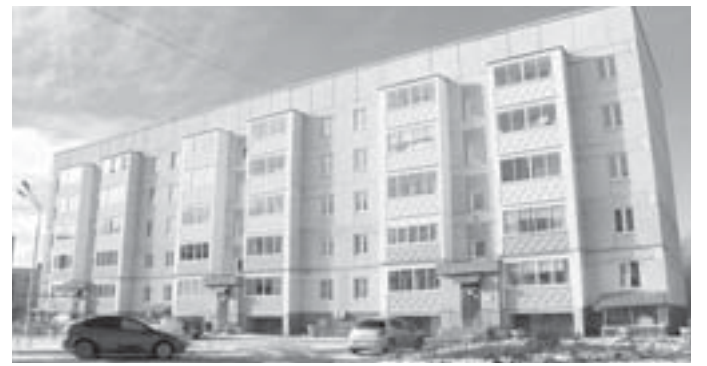
Дом № 1 в микрорайоне Центральный находится под управлением УралЖилКонторы

Стоит сказать, что на обслуживании УЖК находятся четыре дома южной части города: микрорайон Центральный, 1, Победы, 2А, Челюскинцев, 12, Ломоносова, 14. А суть претензий банальна и стара как мир: посредник в лице управляющей компании «УралЖилКонтора» деньги за поставку энергоресурсов с потребителей (то есть с жильцов) взял, но до поставщика (МУП) не донёс. По дороге придумал себе оправдание: дескать, услуги были некачественными, но подтверждающими документами не заручился. При этом счета жильцам УЖК выставляла регулярно и деньги от них получала. Куда тратила? По всей вероятности, на создание собственного имиджа. К слову, люди по-настоящему довольны тем, как УЖК содержит их дома. Вопрос «На чьи средства?» не звучал.