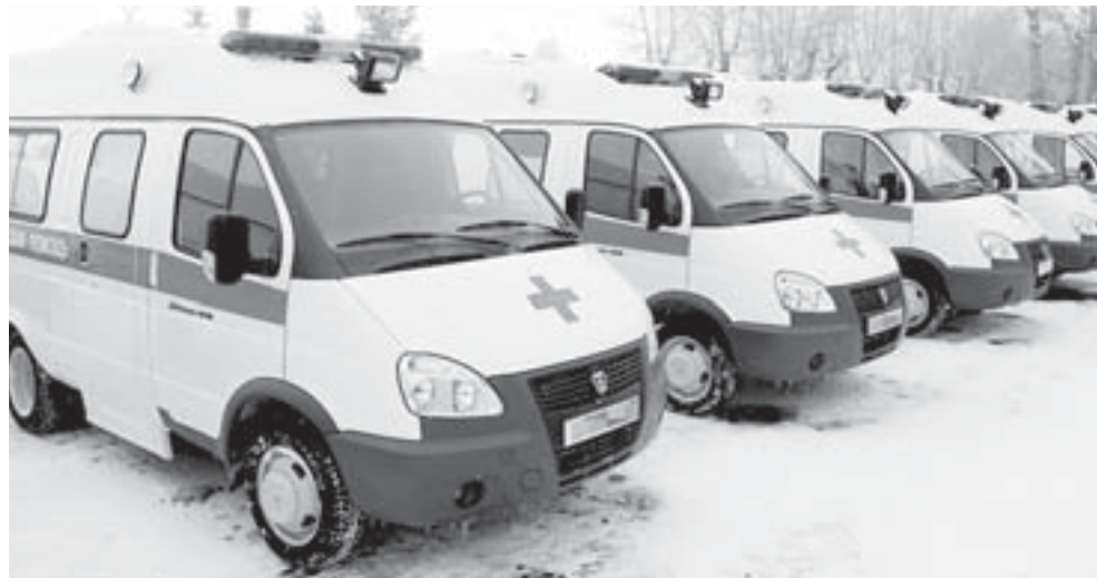
Новые машины оборудованы дефибрилляторами, электрокардиографами и другими необходимыми самыми современными приборами для оказания экстренной помощи

В Полевской и ещё несколько городов Свердловской области поступили новые машины скорой помощи