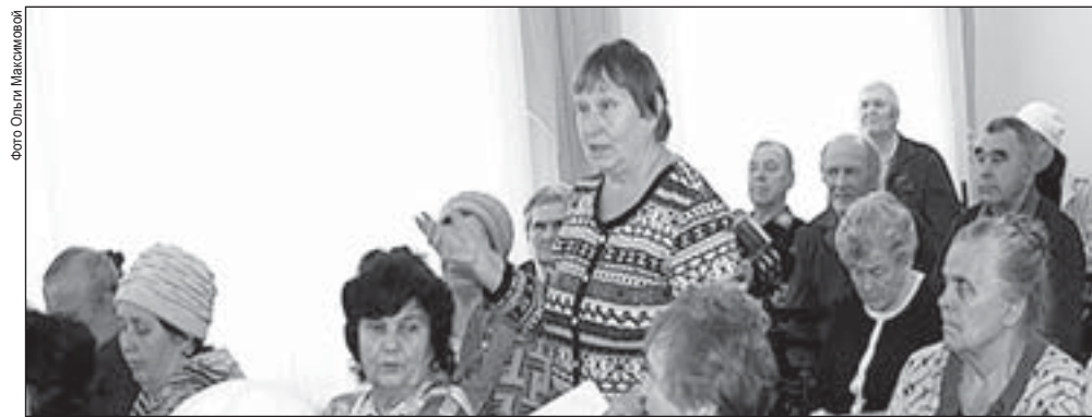
Жители «юга» интересовались, когда улучшится ситуация с теплоснабжением, отремонтируют дорогу по улицам Карла Маркса и Бажова и приведут в порядок тротуары

– На сегодняшний день к системе теплоснабжения полностью подключён жилой