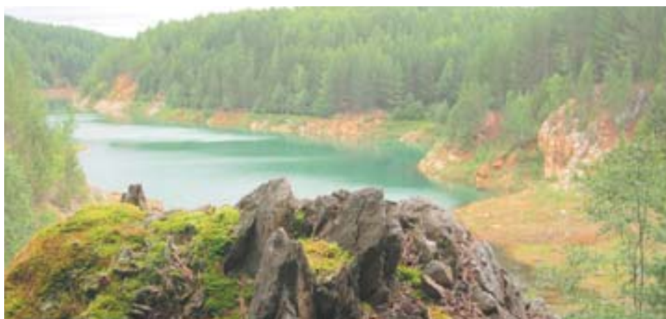
Ивановский рудник. 2015 год

Если у вас есть раритетные фото, связанные с жизнью Полевского, принесите их в редакцию. Газета «Диалог» предлагает своим читателям ещё