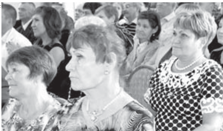
На торжественный вечер пришли и первые директора ДЮСШ