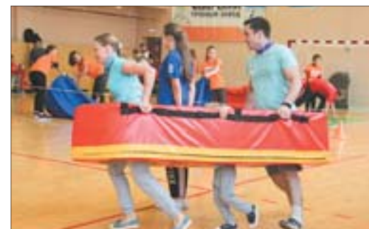
Маленький капитан мчался практически вслепую. Балл за отважность!