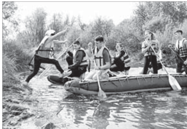
Одним из новшеств стала водная переправа – ребята спасали «тонущего» товарища

Настоящий ажиотаж вызвал у ребят ещё один новый для традиционного турслёта этап, «Веломарафон». Его участники на своих велосипедах преодолели целую полосу препятствий – выполняли упражнения «змейка», «ворота», проезжали по неустойчивым частям дороги.