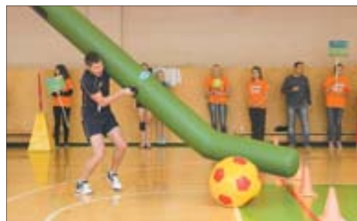
«Гигаключка» оказалась невероятно неуправляемой, родителям пришлось хорошо потрудиться, зато детям вручили спортивный инвентарь более привычного размера