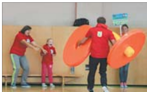
Конкурс «Штанга» – самый быстрый. Основная задача папы – дотащить конструкцию, собранную семьёй, до финиша