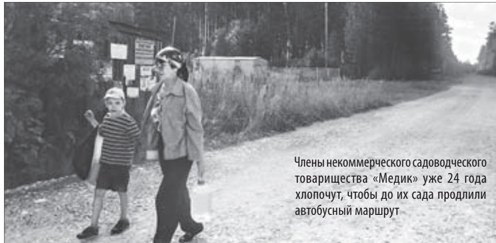
Члены некоммерческого садоводческого товарищества «Медик» уже 24 года хлопчут, чтобы до их сада продлили автобусный маршрут

Полевчане на свои средства отсыпали дорогу до коллективного сада