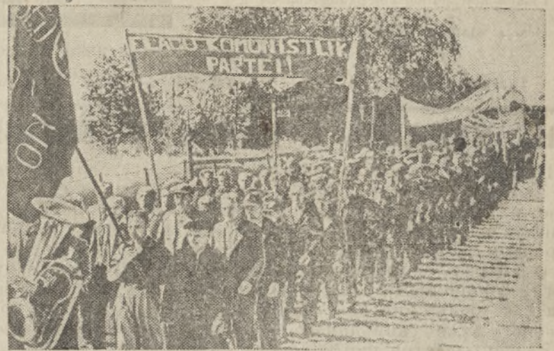
Трудящиеся Таллина направляются на митинг на площадь Свободы Фото-Клише ТАСС.

По всей Эстонии состоялись массовые митинги и демонстрации трудящихся, приветствовавшие Коммунистическую партию и победу «Союза Трудового Народа Эстонии» на выборах.