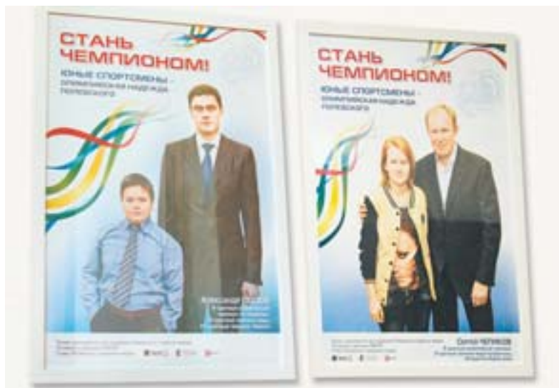
Участники проекта «Стань чемпионом» фотографировались с известными спортсменами

Известные спортсмены рассказали о том, что делается для популяризации массового спорта в Свердловской области