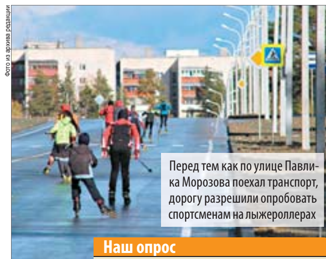
Перед тем как по улице Павлика Морозова поехал транспорт, дорогу разрешили опробовать спортсменам на лыжероллерах

– Хорошие дороги не только обеспечивают высокую транспортную доступность территории, они создают совершенно новое качество жизни: комфорт, динамичность, безопасность. В 2016 году на ремонт дорог муниципалитетам выделено более двух миллиардов рублей, и это без учёта субсидий Екатеринбургу и другим крупным муниципальным образованиям. Это беспрецедентная сумма за последние пять лет. Сегодня задача местных властей и общественных активистов – контролировать работу подрядчиков, чтобы те выполнили взятые обязательства вовремя и с надлежащим качеством. В Полевском, чтобы реализовать проекты по масштабному ремонту автодорог, муниципалитетом своевременно была подготовлена документация, проведены необходимые согласования и конкурсные процедуры. Местная власть сделала всё, что в данном случае необходимо, депутаты одобрили – и город получил деньги.