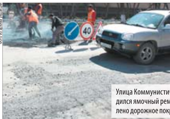
Улица Коммунистическая: до 2014 года здесь проводился ямочный ремонт, в 2014 году полностью обновлено дорожное покрытие от въезда в город до ДК СТЗ