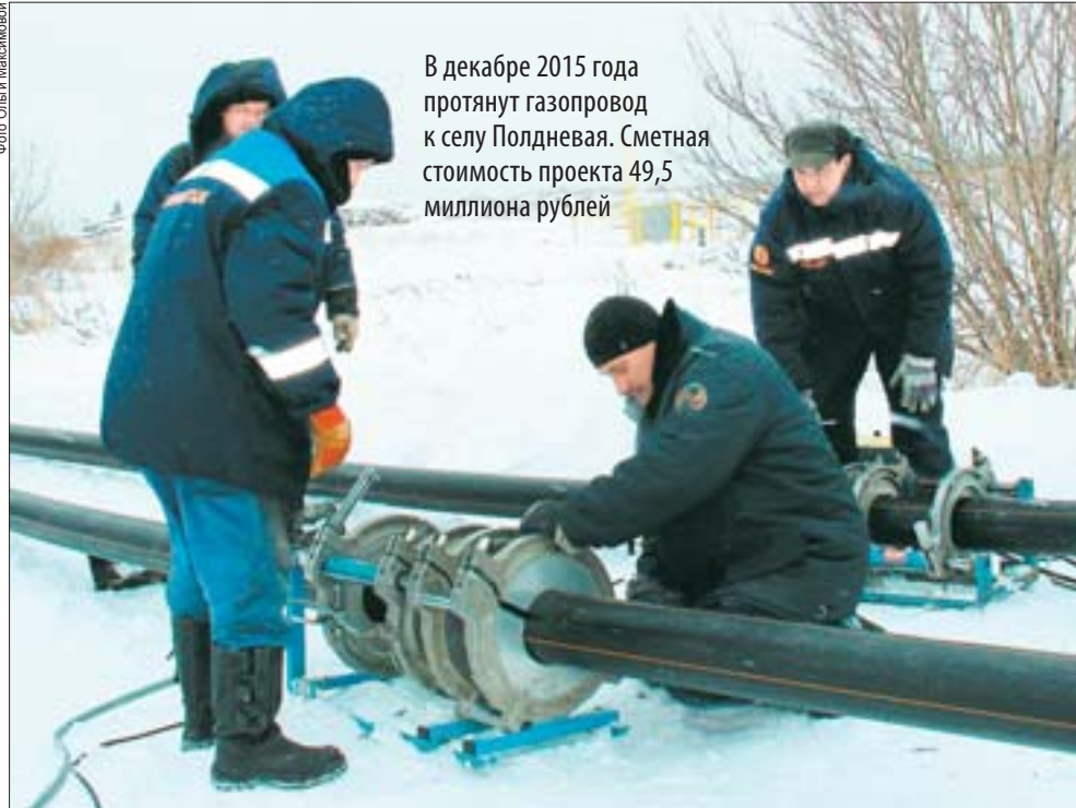
В декабре 2015 года протянут газопровод к селу Полдневая. Сметная стоимость проекта 49,5 миллиона рублей

Надо отметить, что газификация округа будет продолжена и в других районах. К примеру, построен распределительный газопровод по улице Урицкого в южной части города и по улице Максима Горького в селе Косой Брод. Заключены договоры на проектно-сметную документацию в селе Мраморское по улицам Лесная, Пушкина, Рабочая, 1 Мая, Садовая, Советская, в посёлке Станционный-Полевской по улицам Свердлова и Лесная, во втором отделении совхоза по улицам Полевая и Садовая, в посёлке Зюзельский по улице Красноармейская.