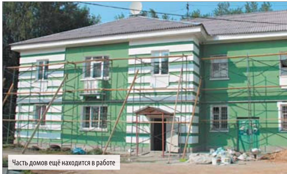
Часть домов ещё находится в работе

Ремонт жилищного фонда города и региона – в центре внимания властей, общественников и обычных граждан