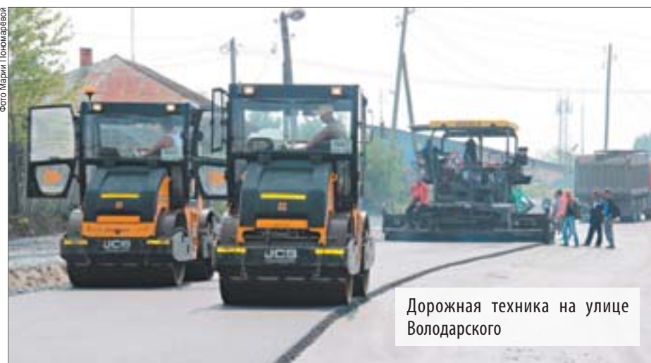
Дорожная техника на улице Володарского