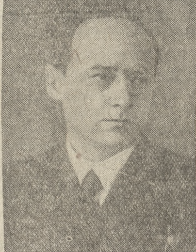
Адмирал Н. С. Исаков.