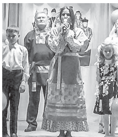
На сцене Дома культуры села Курганово ансамбль «Вечора»