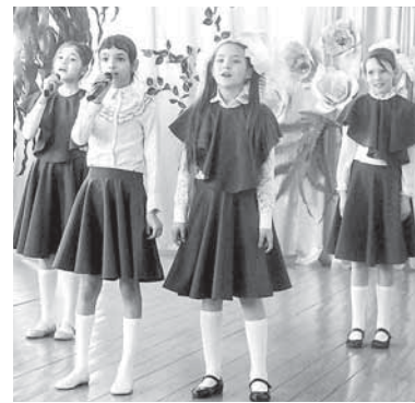
В Полдневой группа «Браво» вышла на сцену в новых костюмах

В Станционном-Полевском, Косом Броду и Зюзельском концерты в рамках фестиваля «Деревня – сердце России» пройдут в ближайшее время. В посёлке Станционный-Полевской – 1 апреля, в селе Косой Брод – 7 апреля, в посёлке Зюзельский – 8 апреля.