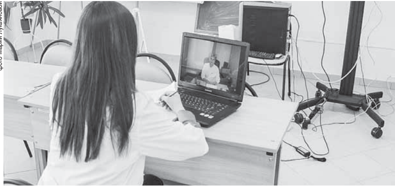
В 2016 году чаще прочих для полевчан проводились телеконсультации иммунолога – их организовано 146

врачи нашей больницы получают возможность учиться у более квалифицированных коллег.