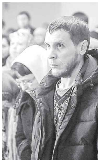
Русский народ выжил, но ценой невероятных жертв

— Главное — не стремиться начинать всё сначала, не желать с позиции силы восстанавливать социальную справедливость, иными словами, топить в крови оставшуюся часть рус-