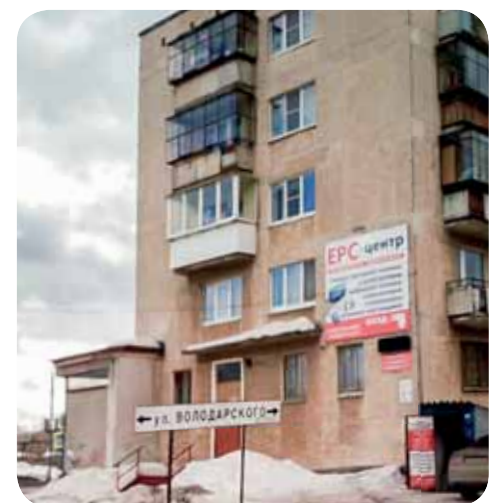
График работы центра – с понедельника по субботу с 10.00 до 19.00.