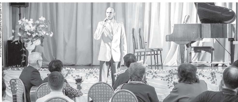
В течение полутора часов в малом зале Дворца культуры Северского трубного завода любители прекрасного наслаждались лучшими поэтическими и музыкальными произведениями