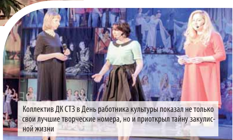
Коллектив ДК СТЗ в День работника культуры показал не только свои лучшие творческие номера, но и приоткрыл тайну закулисной жизни

ских коллективов, но и некоторую часть закулисной жизни, той, где рождается это творчество. Получился настоящий театр, а постановка «Побольше аншлагов и море оваций» завоевала больше зрительское «Спасибо!».