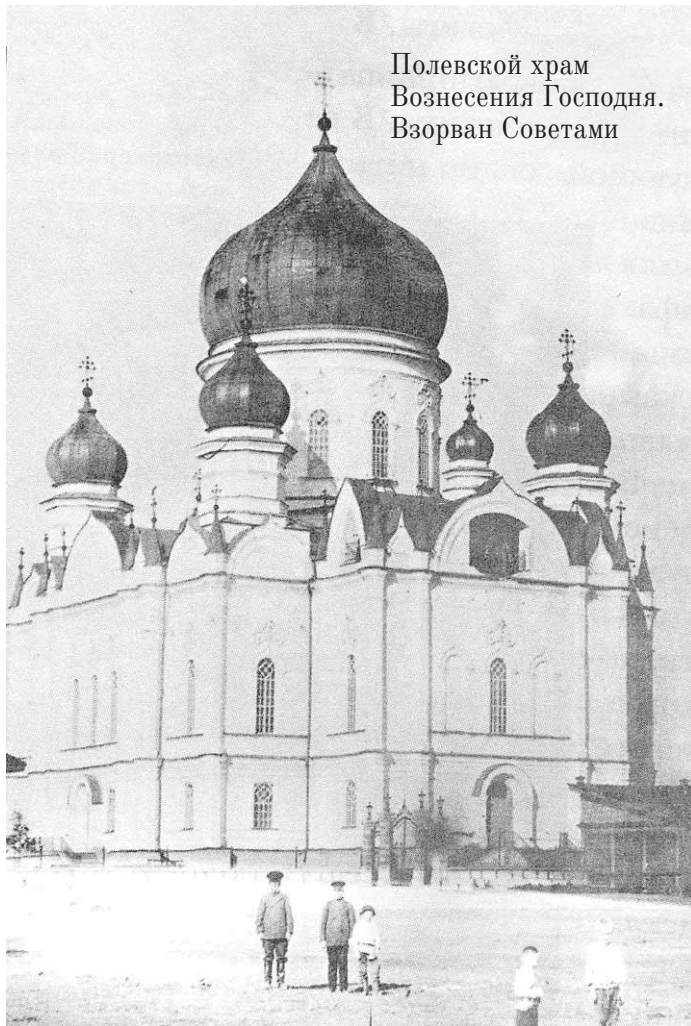
Полевской храм Вознесения Господня. Взорван Советами

Старушка быстро и мелко перекрестилась. По площади ходили люди в шапках, с шёлковыми красными бантами на груди и размахивали кумачёвыми полот-