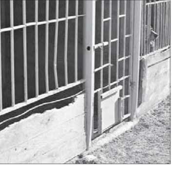
На Малышева, 84, сегодня находится 21 собака. Содержание, питание, ветеринарное обслуживание каждой обходится муниципалитету в 218 рублей в сутки

Содержание одной собаки в питомнике по условиям муниципального контракта обходится в 218 рублей в сутки. Содержание в течение 180 дней: двухразовое питание, обеспечение водой, ежедневная санитарная уборка и дезинфекция вольеров, а также ветеринарное сопрово-