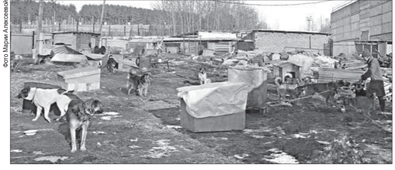
В приюте для бездомных животных фонда «Добрые руки» 230 собак. Они содержатся за счёт благотворительной помощи полевчан и местных предприятий

Питомник временного содержания отловленных собак находится по адресу ул. Малышева, 84, телефон 2-33-23. Диспетчер предприятия работает круглосуточно