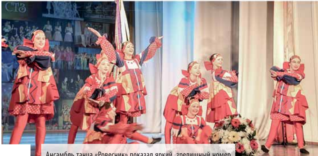
Ансамбль танца «Ровесник» показал яркий, зрелищный номер «Масляная»

— Это удивительно! Наш город не такой большой, а сколько здесь талантливых творческих людей, настоящих профессионалов! Я испытала гордость за родной город. На сцене кипит настоящая жизнь, жаль, что не все мы это видим, — в фойе Дворца культуры Северского трубного завода поделилась своими впечатлениями после праздника зрительница. Женщина не подозревала, что говорила с корреспондентом, но, как нам показалось, выразила мнение, с которым из ДК уходили участники мероприятия.