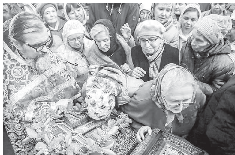
Крест в православии — символ жертвенной любви и смирения, противостоящих вражде и разделению

ния царя в марте 1917 года Бог не дал русскому народу другого вождя и путеводителя. Избрание патриарха в августе 1917 года — это в какой-то мере следствие «обезглавления» народа, которое свершилось ранее.