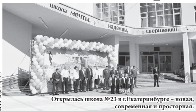
Открылась школа №23 в г.Екатеринбурге – новая, современная и просторная.

Так, в школе №17 за счёт средств градообразующего предприятия обновилась крыша, большие