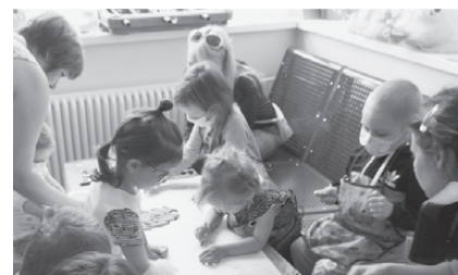
В центре детской онкологии и гематологии ОДКБ №1 в рамках проекта «Искусство против рака» прошло увлекательное занятие, это помогает отвлечь маленьких пациентов от больничных будней.

работе терапевтических групп. Это один из наиболее результативных инструментов комплекса реабилитационных мероприятий, который позволяет охватить, в том числе, близкое окружение зависимого человека. В группе каждый пациент может глубже осознать происходящие изменения, сформировать новые ценностные ориентиры, ответить на наболевшие вопросы и, опираясь на опыт и поддержку одногруппников, наметить цель преодоления зависимости. Наш