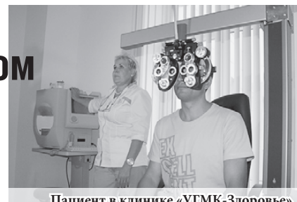
Пациент в клинике «УГМК-Здоровье»

Оренбургские врачи смогли ознакомиться с организацией современной лучевой диагностики, увидели стройку второй очереди