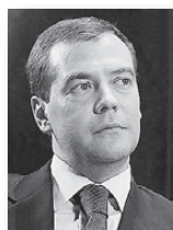
Дмитрий Медведев, председатель Правительства Российской Федерации: «ИННОПРОМ

– это крупнейшее начинание, крупнейшая индустриальная выставка. Но мы её проводим не для того, чтобы похвастаться, а для того, чтобы новые технологические решения воплощались в жизнь, создавались новые производства, открывались новые заводы».