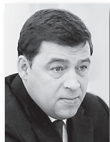
Евгений Куйвашев, губернатор:

Общий объем инвестиций в развитие в 2016 году может достигнуть 50,2 млрд рублей