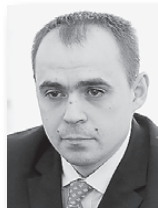
Андрей Мисюра, министр промышленности науки Свердловской области:

«Участники получают дополнительные разряды, идут получать второе высшее образование, становятся наставниками на своих предприятиях и привлекают молодежь в профессию».