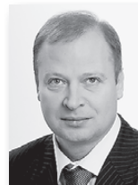
Виктор Шептий, вице-спикер областного парламента, секретарь Свердловского регионального отделения «Единой России»:

Стоит напомнить, что с 1 января 2016 года вступил в силу инициированный единороссами областной закон «Об отдельных вопросах реализации в Свердловской области промышленной политики Российской Федерации».