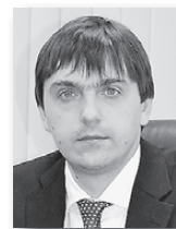
Сергей Кравцов, руководитель Федеральной службы по надзору в сфере образования и науки

«Региональный этап Всероссийского конкурса «Учитель года России-2016» позволяет не просто поощрить лучших, а дает возможность распространить инновационные наработки внутри системы образования, а значит, школьники региона в процессе обучения получают самое лучшее и впоследствии могут выбрать любой техникум, вуз и любую специальность».