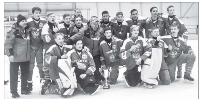
Сборная России – победитель первенства мира среди младших юношей

Если говорить о традиционном соперничестве двух ведущих в этом виде спорта держав, России и Швеции, то оно нынче закончилось в пользу наших соотечественников. Россияне выиграли три турнира (национальные сбор-