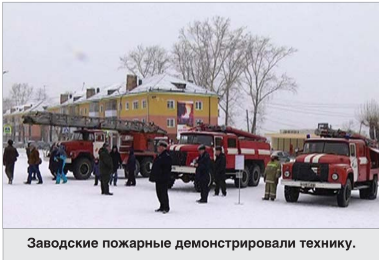
Заводские пожарные демонстрировали технику.