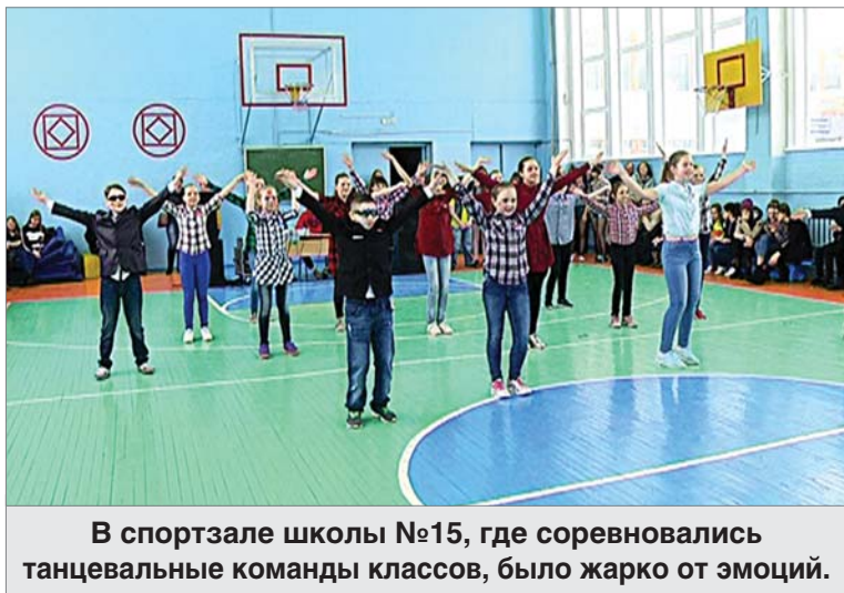
В спортзале школы №15, где соревновались танцевальные команды классов, было жарко от эмоций.

Возле Дворца, несмотря на холодный ветер и метель, заводские пожарные демонстрировали технику, показывали, как огнеборцы действуют в чрезвычайной ситуации. Очень кстати была солдатская каша. Для детворы организовали конкурсы, шла торговля. Пели и танцевали артисты ДК, был показан кусочек готовящегося во Дворце спектакля для детей.