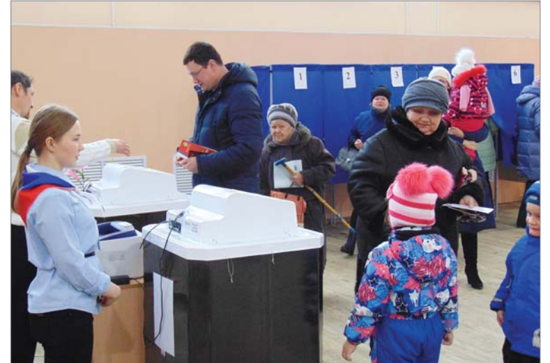
На избирательный участок в ДК «Огнеупорщик» многие приходили семьями.