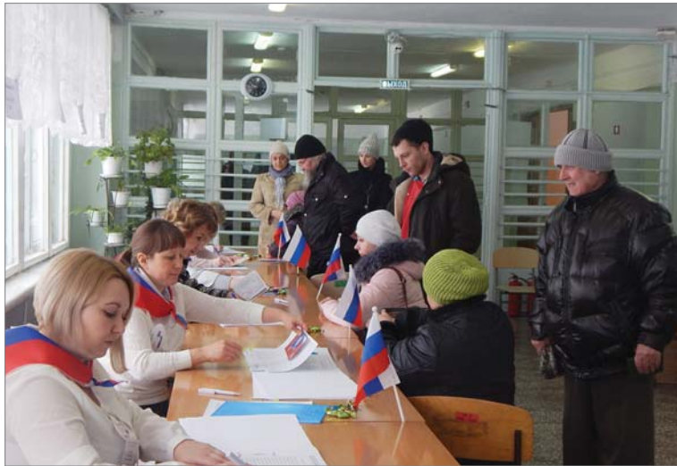
Людской поток к школе №15, на избирательный участок №2376, не прекращался.