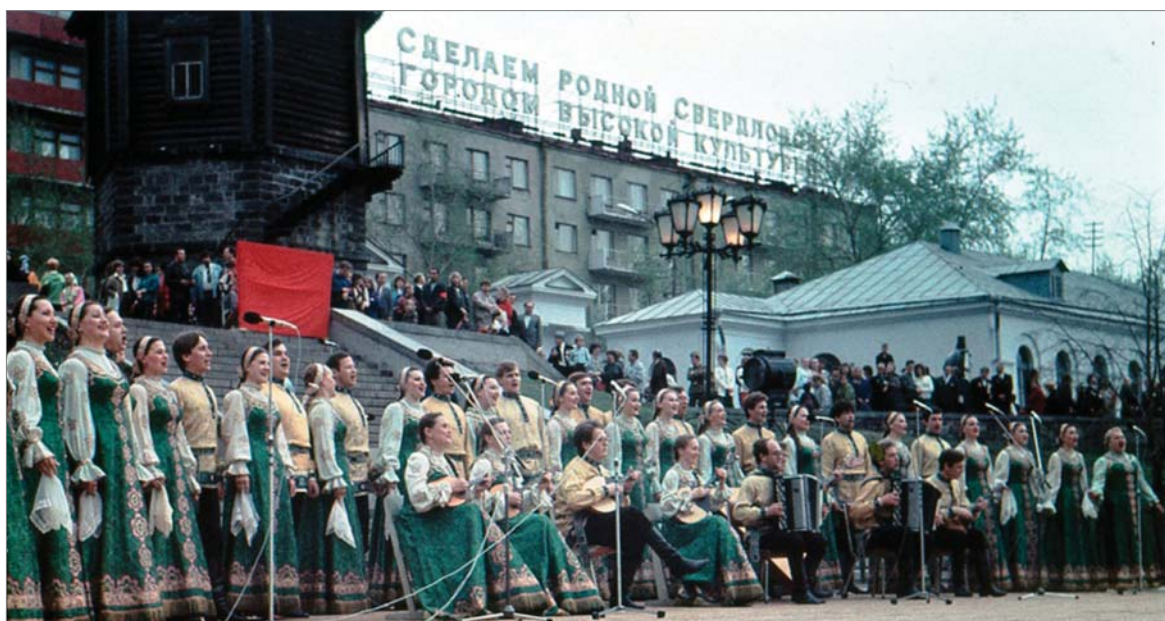
Хор выступает на Плотинке в День Победы. Начало 90-х.