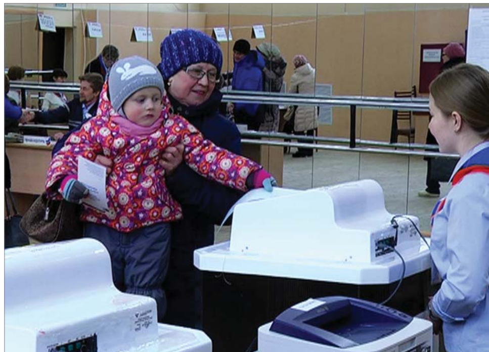
По данным центральной избирательной комиссии 18 марта 2018 года итоги голосования на выборах Президента Российской Федерации