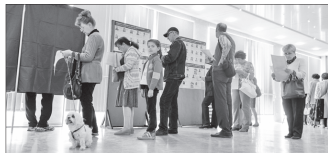
На избирательных участках было многолюдно