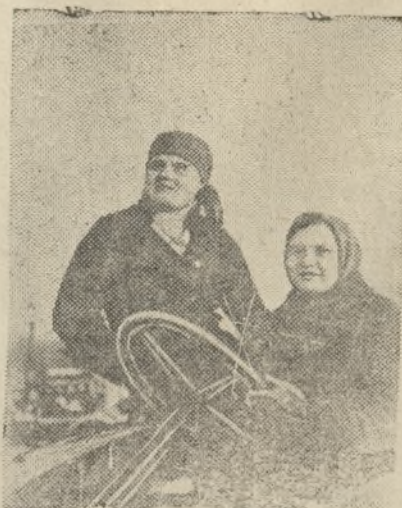
13 девушек обучаются на курсах трактористок при Москвинской МТС Камышловского района

Пора по-настоящему взяться за ремонт и в ближайшие дни закончить, а от руководителей района требуется практическая, живая помощь, так как время не ждет.