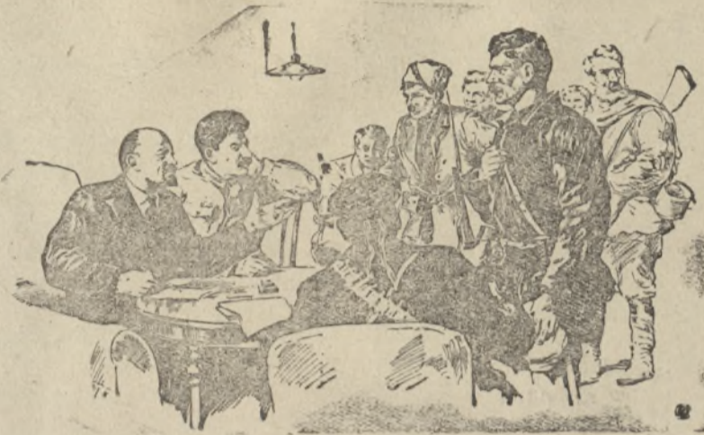
В. И. Ленин и И. В. Сталин в 1918 году.

«Я всегда готов по приказу Рабоче-Крестьянского Правительства выступить на защиту моей Родины—Союза Советских Социалистических Республик и, как воин Рабоче-Крестьянской Красной Армии, и клянусь защищать ее мужественно, умело, с достоинством и честью, не щадя своей крови и самой жизни для достижения полной победы над врагами».