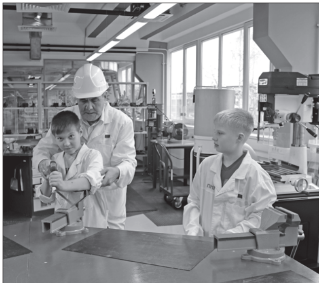
В рамках взаимодействия будут организованы производственные стажировки для учащихся лицея

– Мы наблюдаем, что с каждым годом уровень профессионального образования в Свердловской области повышается. Так, показательные результаты WorldSkills в 2014 году на чемпионате регион завоевал 14 медалей, а по итогам 2015 года – уже 28. Это возможно благодаря мероприятиям, реализуемым в рамках Уральской инженерной школы, специализированных центров компетенций,