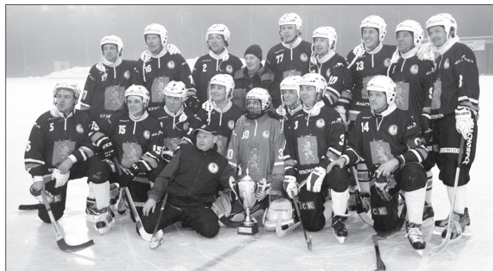
Команда «Ветераны Красноярска» выиграла соревнования двух предыдущих розыгрышей Кубка России, а минувшей осенью стала обладательницей Кубка мира

Игры проводятся по правилам хоккея с мячом с некоторыми особенностями. Так, запрещаются удары клюшкой по мячу, пробиваются 9-метровые штрафные броски, положение «вне игры» не фиксируется, удаления за нарушение правил – на две и четыре минуты.