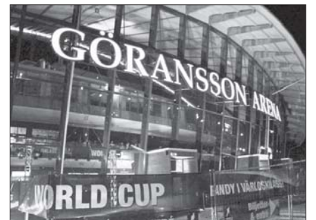
Соревнования Кубка мира пройдут на льду «Йоранссон-Арены» в Сандвикене