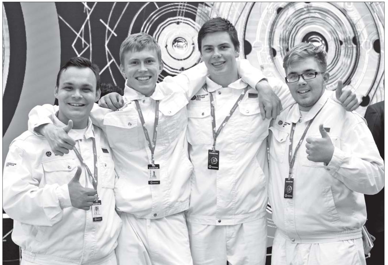
Студенты, обучающиеся по программе «Будущее белой металлургии», приняли участие в работе стенда Группы ЧТПЗ на ИННОПРОМЕ-2017