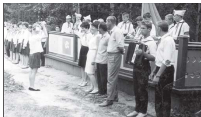
Открытие загородного пионерского лагеря «Орлёнок» в июне 1967 года

Сегодня у некоторых есть желание охаять комсомол и пионерии. Но в этих организациях, считаю, много было хоро-