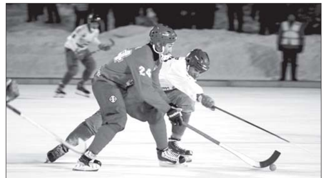
Фрагмент матча «Уральский трубник» – «Водник» в регулярном чемпионате

Вчера команды Суперлиги начали матчи плей-офф чемпионата России по хоккею с мячом. «Уральский трубник» принимал архангельский «Водник», сегодня состоится повторная встреча команд (начало в 19:00).