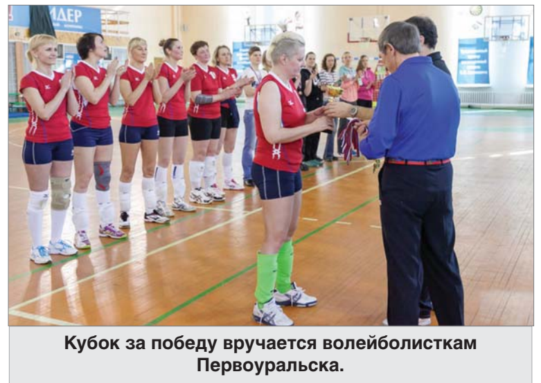
Кубок за победу вручается волейболисткам Первоуральска.