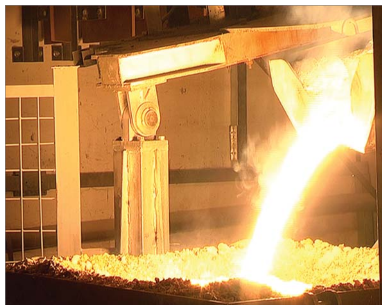
Так выглядит «слив».

дробим, - уточняет он. - Дух перевести некогда. Последняя плавка была — как начали с восьми часов, только полвторого присели. Внимательно следим за качеством, сами настраиваем дробилки и к плавке подходим ответственно.