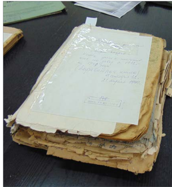
Алфавитная книга поступивших на завод с 1942 по 1949 годы.