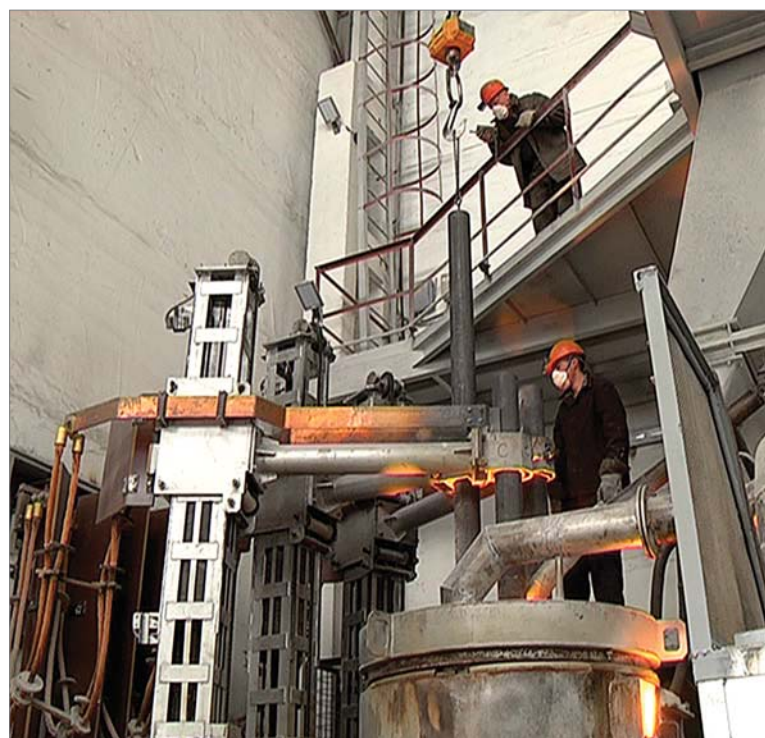
Подготовка печи РКЗ-1 к плавке диоксида циркония, июль 2016 года.