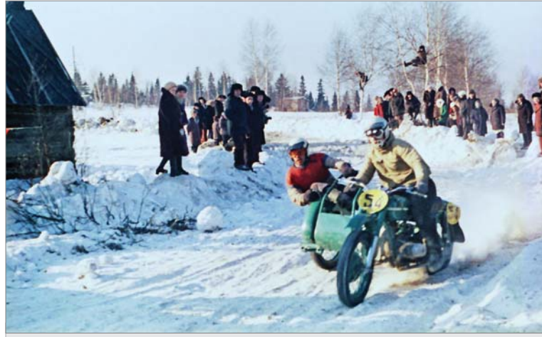
Трасса мотокросса проходила за домом №32 по улице Пушкина.