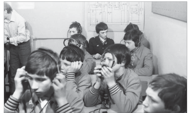
В учебном классе секции ДОСААФ юные радиолобители учились паять, изучали азбуку Морзе.