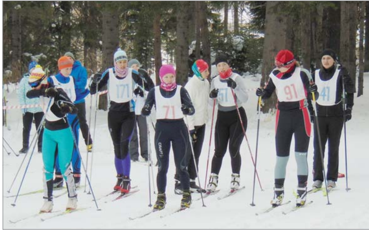
На старте - представители одиннадцати команд.

Участники соревновались в пяти дисциплинах - волейбол, плавание, дартс,