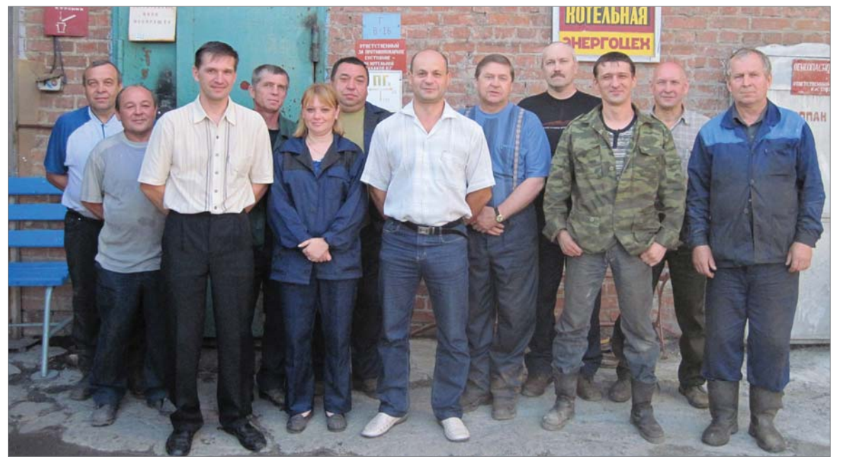
2012 год. Коллектив котельной энергоцеха.

Энергетика включает в себя ещё газо- и водоснабжение. Первая газогенераторная станция была построена на заводе в год его рождения. Топливо — уголь. Вырабатывался газогенераторный газ для обжига огнеупорной продукции в печах первого и второго цехов. Когда протянули газопровод «Бухара — Урал» на завод пришёл природный газ, в 1968 году газификация