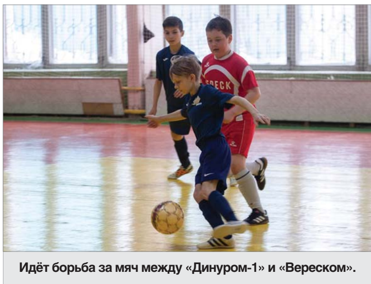
Идёт борьба за мяч между «Динуром-1» и «Вереском».

Дети 12-13 лет сошлись в турнире по мини-футболу, посвящённому Дню защитника Отечества. 19 февраля в спортзале комплекса ОАО «ДИНУР» прошёл четвёртый «Путь чемпиона», участие в котором приняли шесть команд. Организатор соревнования - «Первоуральск – город чемпионов».