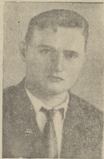
На снимке: Депутат Мурманского областного Совета капитан Героического экипажа ледокола „Георгий Седов“ Константин Сергеевич Бадыгин.

Совнарком Союза ССР постановил: пожертвовать на оказание помощи пострадавшим от землетрясения в Турции 10 тысяч долларов. (ТАСС).