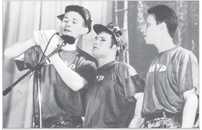
Февраль, 2002 год. «А ну-ка, парни!» - 1-й цех.

- Конечно, цехи №1 и №2, заводоуправление,