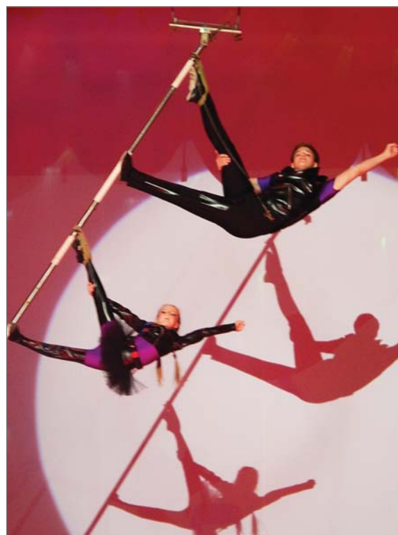
Зрелищных находок в отчётном концерте будет много.

новые номера. Для подготовки тех, что уже опробованы, достаточно двух-трёх занятий в неделю, а на свежие постановки нужно по 4-5. Очень много времени