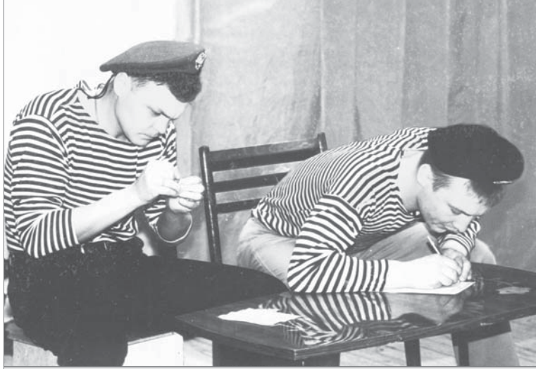
Февраль, 2003 год. «А ну-ка, парни!» - ОВСПО.