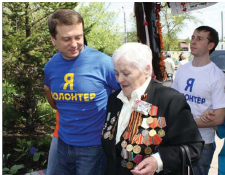
Часто помощь не требует больших затрат и усилий.

в названии. Не случайно и слово «алерт», что в переводе с английского – сигнал тревоги. Сегодня организация работает в 40 регионах страны и продолжает расти.