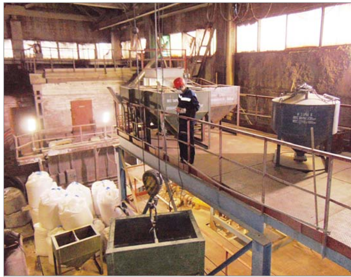
Дробильщик Евгений Кияев на линии по производству жжёного боя.

На линии жжёного боя производят сырьё фракции 0,5-1 для прессоформовочного участка дробильщики Константин Почиталин, Василий Ермаков, Евге-