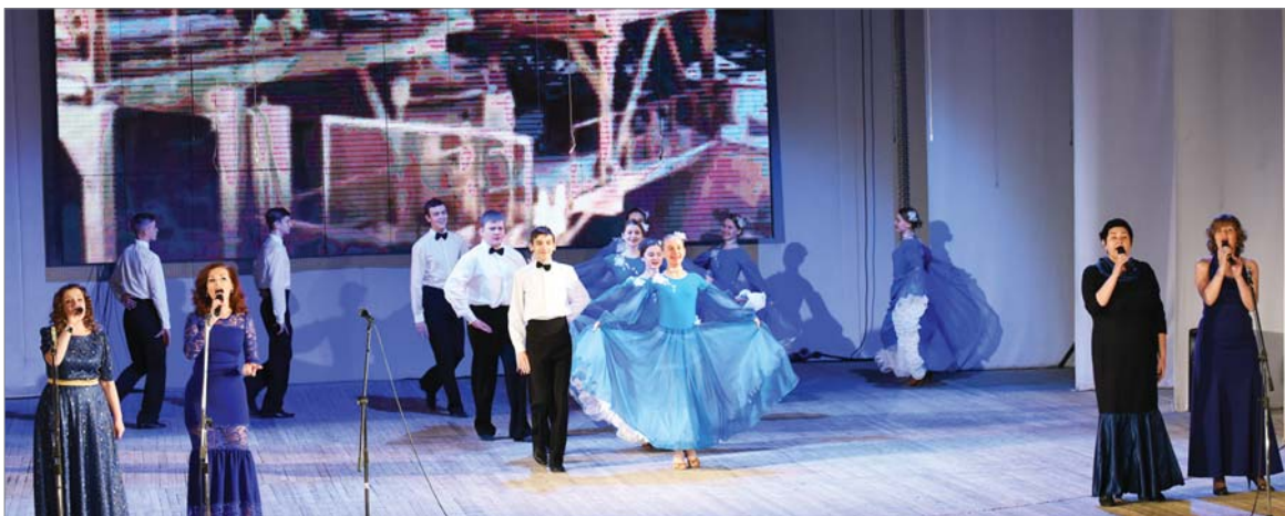
«Вальс о Динасе» тронул публику до слёз.

- продолжает Л.Татаурова. - В этой номинации мы набрали равное количество баллов с работниками машиностроительного завода имени Калинина, и жюри приняло решение — екатеринбуржцам присудить победу, а динуровской творческой группе — звание лауреата.