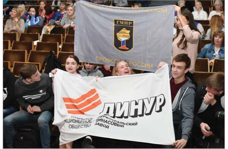
Группа поддержки «болела» за своих, как могла.

- После выступления подошли зрители — работники предприятий, приехавшие из других городов, и говорили, что их до слёз растрогала песня, так красиво дополненная танцем и профессионально созданным телевизионным сюжетом,