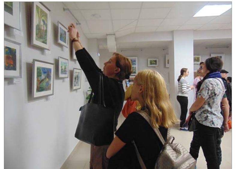
Посетители не скрывали восхищения.

- Задача каждого педагога – музыканта или художника – приобщать детей к музыке образов,