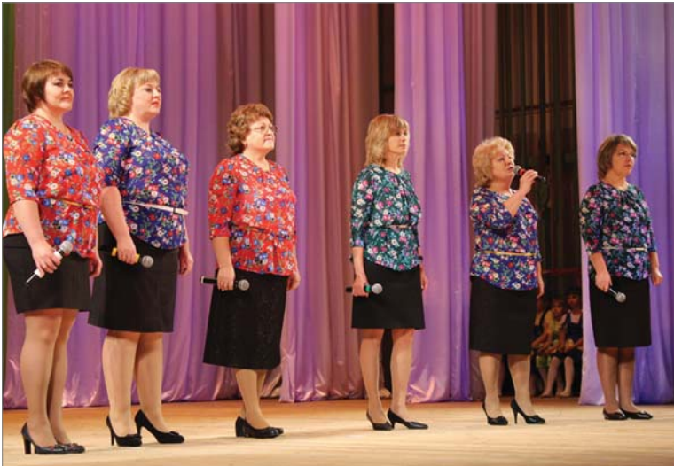
Поющие сотрудницы динасовских детсадов открывали фестиваль.

11 ноября в заводском Дворце прошёл 9-й открытый городской фестиваль хоров и ансамблей «Поющий край». Разновозрастные вокалисты, от детсадовцев до ветеранов, встречали тёплый приём у публики, которая умилялась, восторгалась и не жалела аплодисментов.