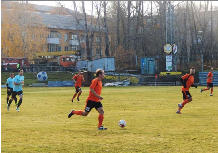
«Динур» - безоговорочный лидер матча.

В прошедшую субботу «Динур» принимал футболистов из Полевского.