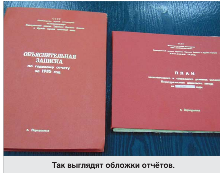
Так выглядят обложки отчётов.

Внимание привлекли броские красные обложки документов с золотым тиснением. Первая — объяснительная записка по годовому отчёту за 1985 год. Недоработок руководство предприятия не скрывает. «План 1985 года не выполнен по трём видам изделий. Допущено отставание по изделиям для воздухоподогревателей доменных печей. Основной причиной тому