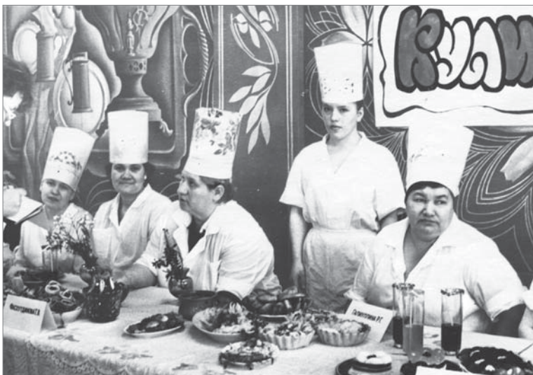
Участницы конкурса «Кулинар-99» представляют блюда.

К истории конкурса обращалась Екатерина ТОКАРЕВА