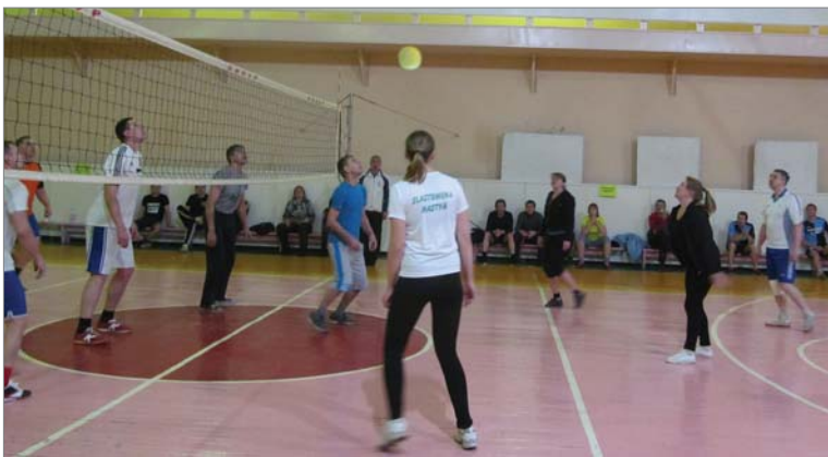
Партию разыгрывают команды цеха №2 и заводоуправления.

В основной группе без поражений до последнего тура шли команды цеха №2 и первый состав волейболистов заводоуправления. В заключительный день соревнований лидеры выясняли, кто же займёт первое место в турнирной таблице. Игра получилась напряжённой: первая партия закончилась в пользу физкультурников заводоуправления, вторая – осталась за цехом №2. И только в третьей определился победитель. С перевесом в два очка этот