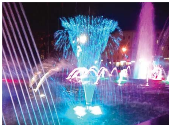
Рисунок фонтана постоянно меняется: то вода струится с краёв в центр, то струи кружатся, то распускаются павлиньим хвостом. Вода может подниматься на высоту 38 метров! Во всей красе фонтан предстаёт в тёмное время суток. Ежедневно в 20-00 он начинает переливаться разными цветами и «танцевать» под музыку. Представление, которое с удовольствием смотрят горожане,

длится 30 минут. Пока на улице температура не опустится до +3 градусов и ниже, фонтан будет работать.