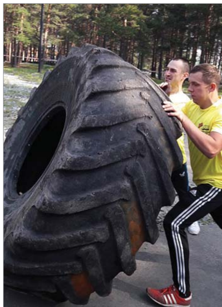
Испытал себя в «Гонке героев», парк Новой культуры, 27 августа.

И мы, первоуральцы, сами не будем ждать чуда, надеяться на «авось» и ждать, когда кто-нибудь за нас уберёт камень с дороги, отремонтирует покосившуюся скамейку, а включимся в обустройство своего двора, своей улицы, клумбы у подъезда, чтобы в будущем с удовлетворением рассказывать своим детям и внукам о том, как делали лучше мир вокруг себя.