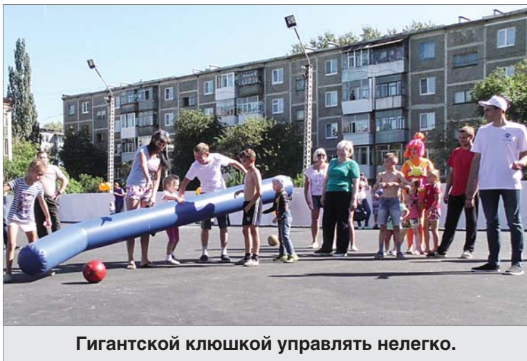
Гигантской клюшкой управлять нелегко.

Идея основательно обновить «коробку» родилась после того, как, откликаясь на просьбу се-