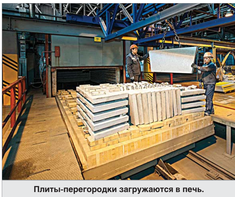
Плиты-перегородки загружаются в печь.

– Людей не хватает, – с сожалением отметила она. – Все субботы рабочие. В прошлом месяце отдыхали только в День металлурга. Никого из смежников не остановили – участок по производству неформованных огнеупоров план выполняет, участок корундографитовых изделий и прессоформовочный второго цеха тоже. Наши собственных по-