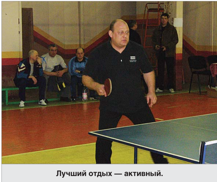
Лучший отдых — активный.

Горное дело меня «затянуло». Уже стал переживать за производство, за рудник, участвовать в спортивной, общественной жизни. Подрастала дочь, и я понял, что надо двигаться дальше, чтобы она могла папой гор-