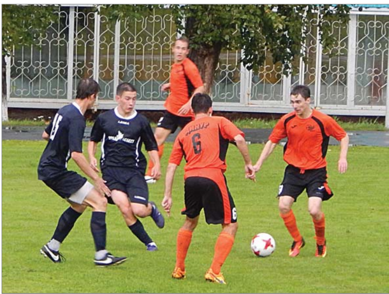
«Динур» чаще владел мячом в этой игре.

Ко второму тайму стали проглядывать синие полоски неба. Футболисты «Дину-